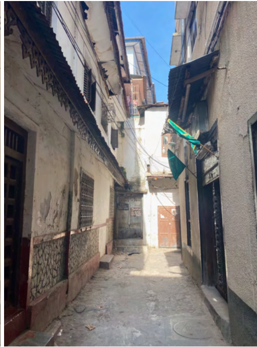
Stone Town, Zanzibar