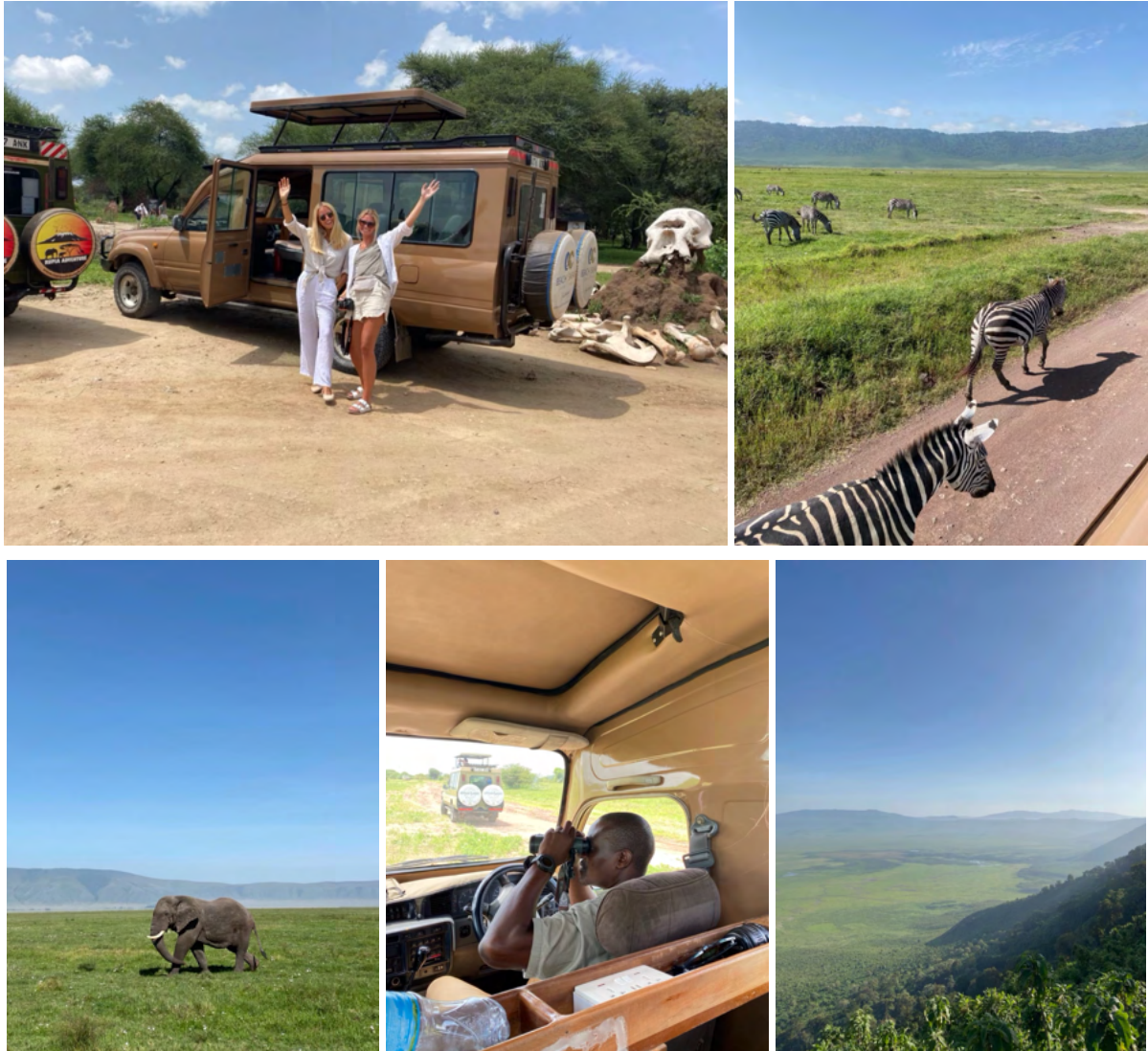
Safari i Tarangire, Ngorongoro och Serengeti

resebyrå istället så fixar de all administration och logistik. Det är ett väldigt starkt tips att åka på safari om ni har tid och möjlighet! Det var verkligen en unik upplevelse. Vi såg det som en examenspresent till oss själva. Det finns också en mindre national park som ligger närmare Dar es-Salaam som heter Mikumi, som också har många spännande djur och bra safari. Här är lite bilder från vår safariresa.