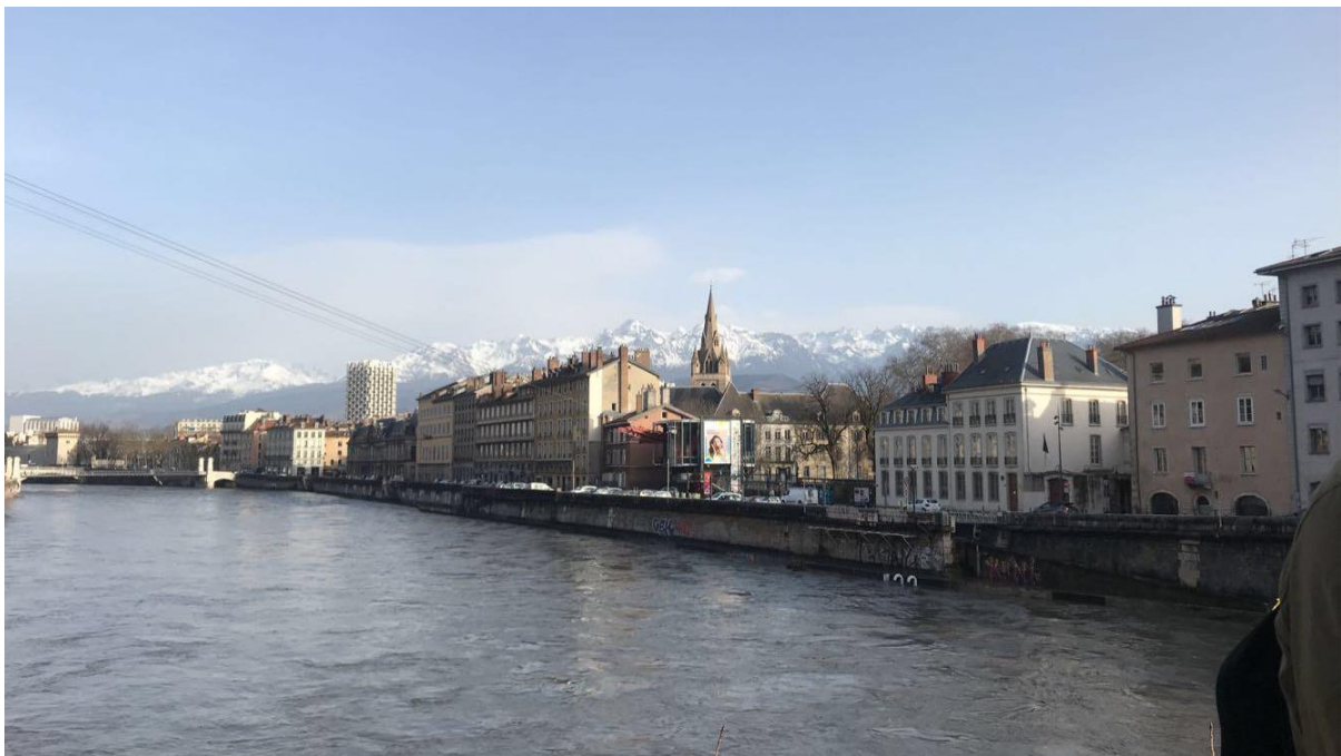
En bit av Grenoble

Staden är omringad av vackra berg och fin natur vilket jag tyckte om. Det var roligt att ha möjligheten att kunna hajka på hösten och sedan åka skidor på vintern/våren. Staden har även ett väldigt fint och grönt campus en bit från stadens centrum.