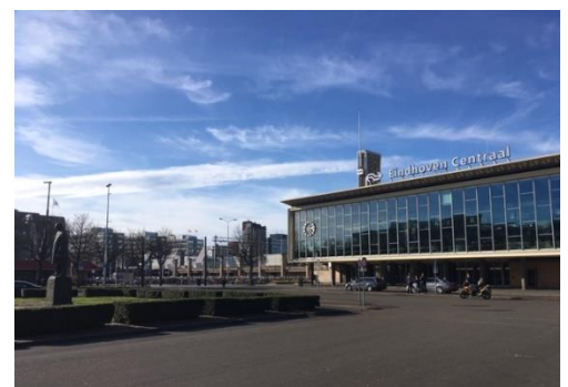
Bild 5: Centralstationen i Eindhoven med en av stadens många Philipsstatyer framför

Tåginfrastrukturen i landet är mycket bra (men lite dyr) och från Eindhoven centralstation går det tåg till Amsterdam varje halvtimme och närliggande städer oftare än så och det är därför väldigt smidigt att åka på dagsutflykter. Från Eindhoven går också flixbuss till massor med olika destinationer, så som Antwerpen och Bryssel i Belgien bara en respektive två timmar bort. Åker du på utbyte på vårterminen kan du fira Karneval som firas i en flera dagar lång fest och parad med aktiviteter dag och natt. Åker du på hösten kan du delta i stadens 'Light festival' där Philips hedras och staden lyser upp och massor med events ordnas. Det finns alltså massor med roligt och spännande att se och uppleva i Nederländerna och Eindhoven. Alla jag träffade var trevliga, talade engelska väldigt väl och var riktigt hjälpsamma. Jag rekommenderar verkligen att åka på utbyte till Eindhoven.