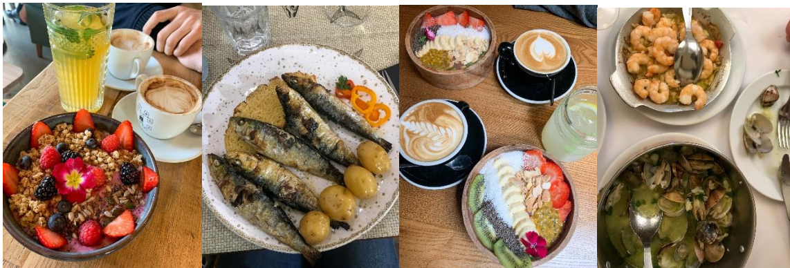
1. Flora och Fauna (Anjos), 2. Restaurante Floresta Das Escadinhas (Rossio), 3. Zenith , 4. Cervejaria Ramiro (Intendente)

Jag har flera tips om restauranger och brunchställen i Lissabon och i Anjos, men har ingen plats för det. Ni får gärna kontakta mig på Facebook eller skicka ett mail till ( enah@kth.se ) om ni har några frågor.