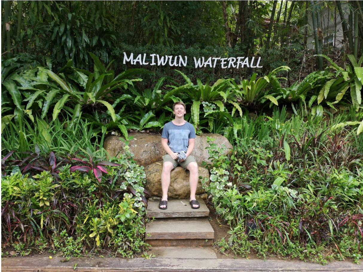
Rundvandring i södra Myanmar