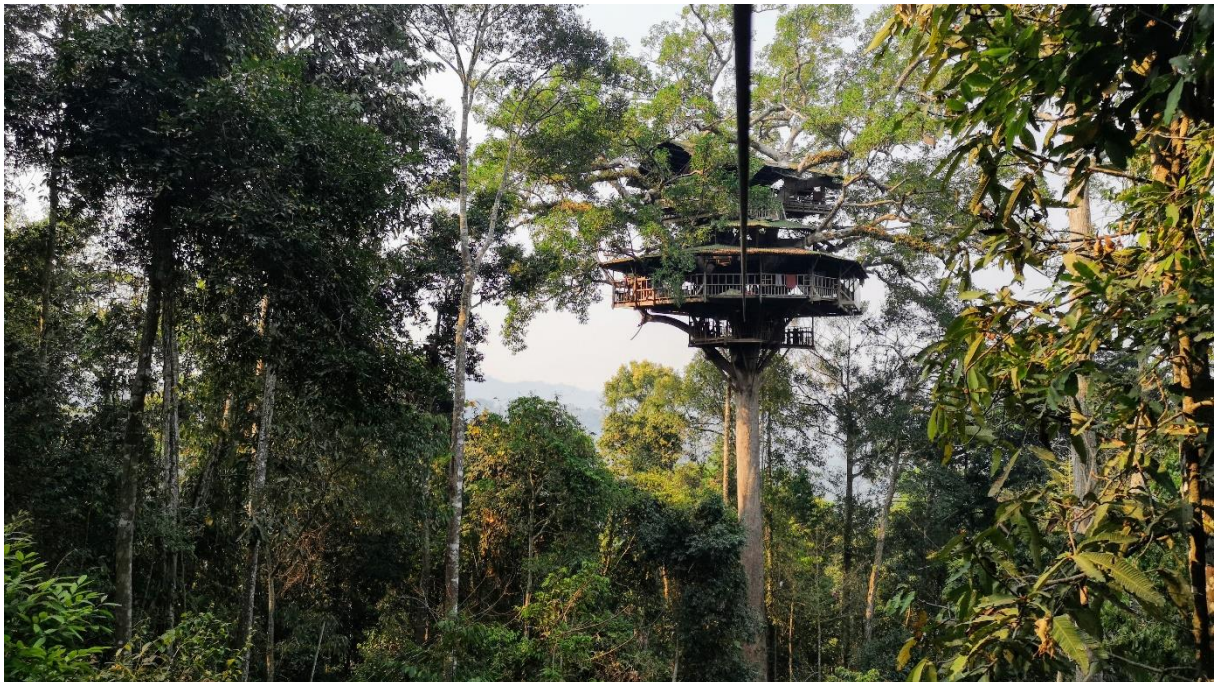
Ziplining i djungeln i Laos med övernattnig i trähus