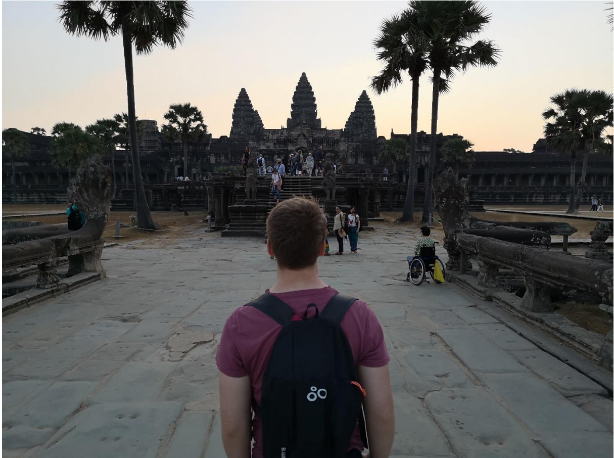
Soluppgång i staden Angkor, Kambodja