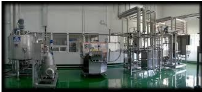
Studiebesök på Kasetsart milk factory