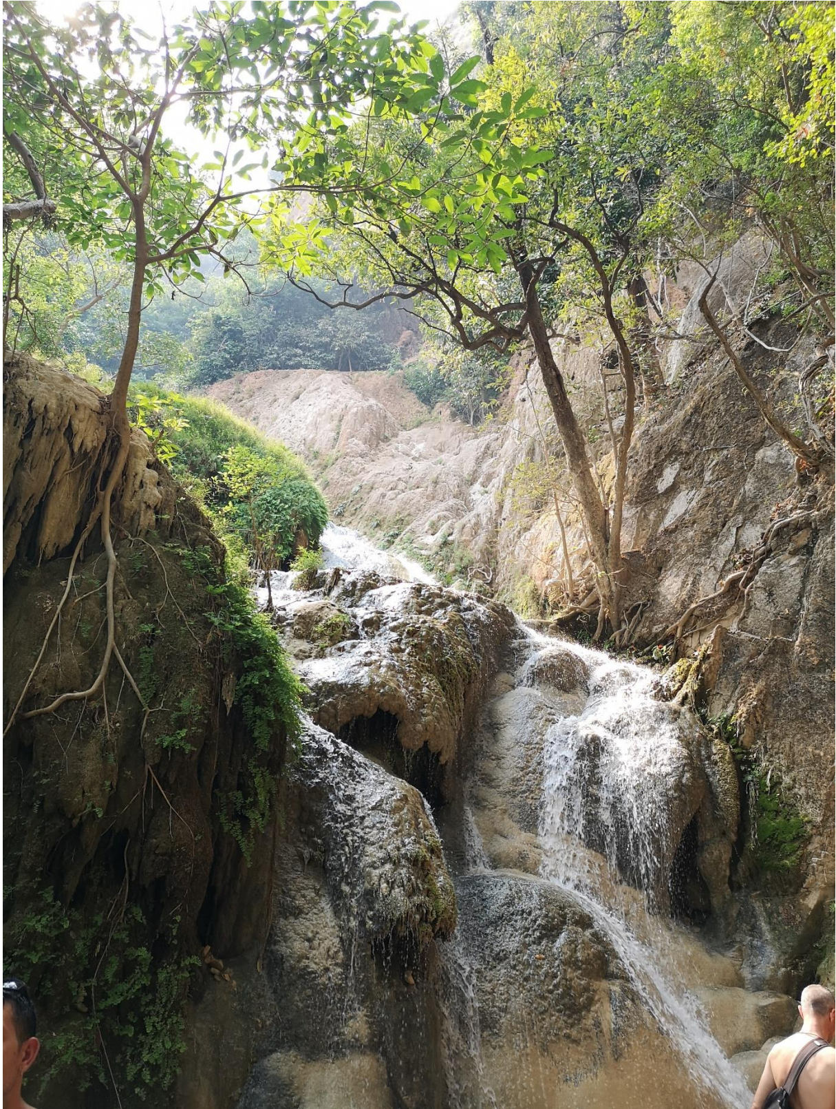
Naturresevat i västra Thailand