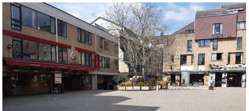
Bilder från staden. Till vänster är en gata i mitten av staden. Högra övre bilden är från ett av biblioteken. Högra nedre bilden är från torget jag bodde intill.