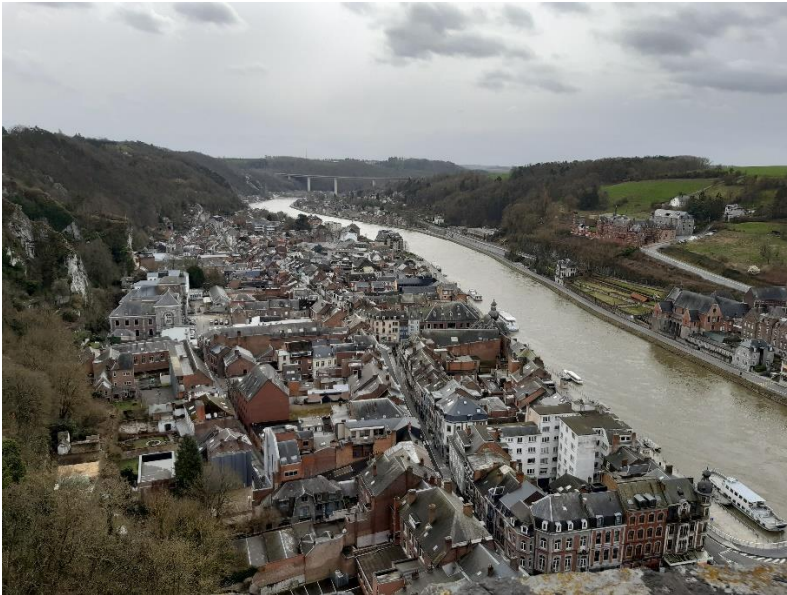
Övre bilden till höger är över staden Dinant, och är tagen från stadens kastell. Nere till vänster är en bild från stadens sjö. Nere till höger är ölprovning på Leffe bryggeriet i Dinant.

Till skillnad från KTH som ligger i en storstad, blir det ett helt annat liv i en liten studentstad som Louvain-la-Neuve. Om du är sugen att testa på en mindre stad med ett rikligt studentliv kan jag rekommendera UC Louvain. Det viktigaste att vara förberedd på är att engelska inte alltid fungerar, du kan tvingas ta dig fram på franska hur bekväm eller obekvämt du än är med det. Jag hade en del problem i början av mitt utbyte kopplat till språkkrockar, men efterhand löste det sig och överlag är jag nöjd med mitt val av utbytesuniversitet.