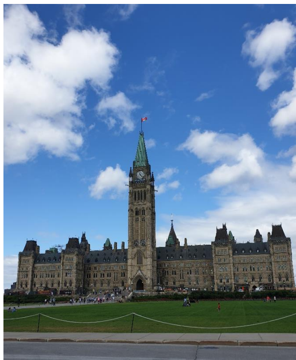
Figur 1. Parliament Hill, Ottawa.