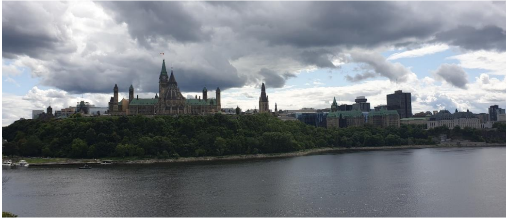
Figur 2. Rundvandring första dagen i Ottawa.