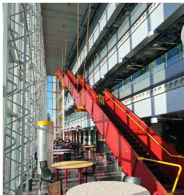
Figur 4. Tabaret Hall och insidan av SITE.