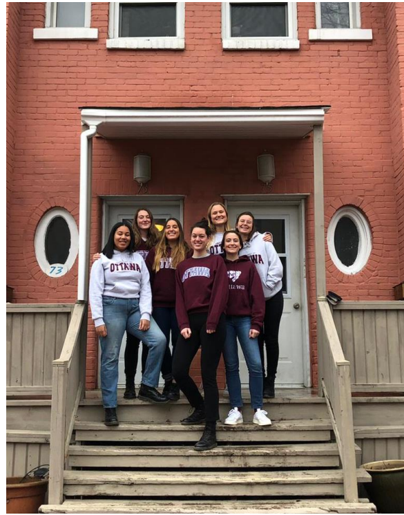
Figur 3. Vårt fina rosa hus som egentligen var svinkallt och fullt med massa krypp, men kul hade vi!