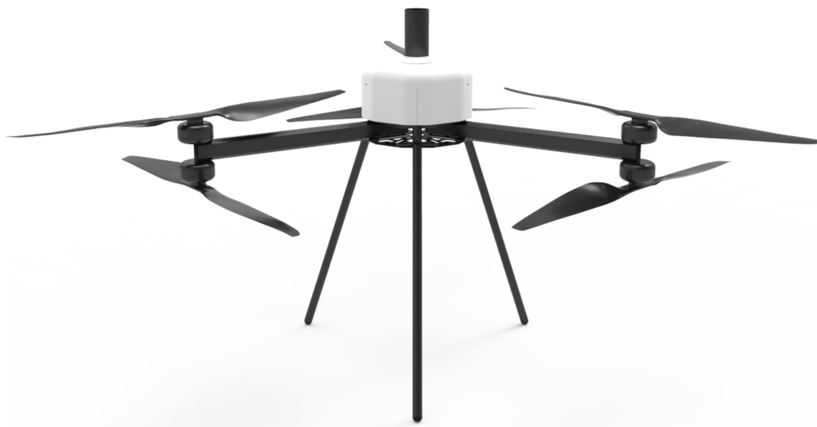
Drönaren med landningsstället