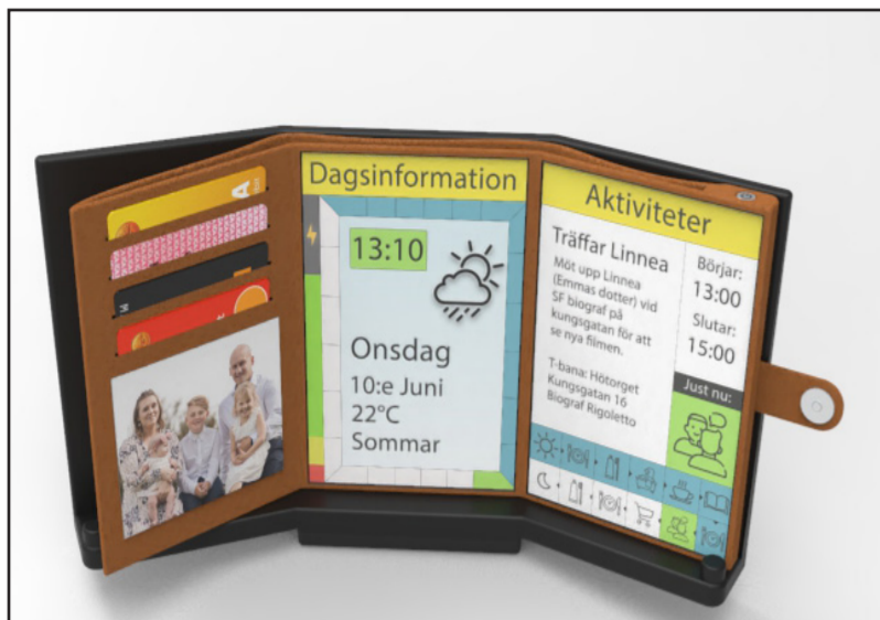
Kortfack, bildfack och två E-ink skärmar.