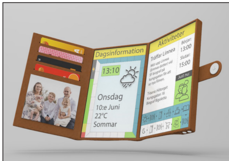
Plånboken i överblicksvy.