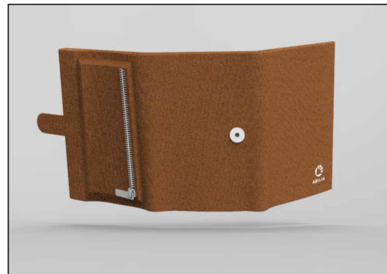
Plånboken bakifrån med flärp och myntfack.