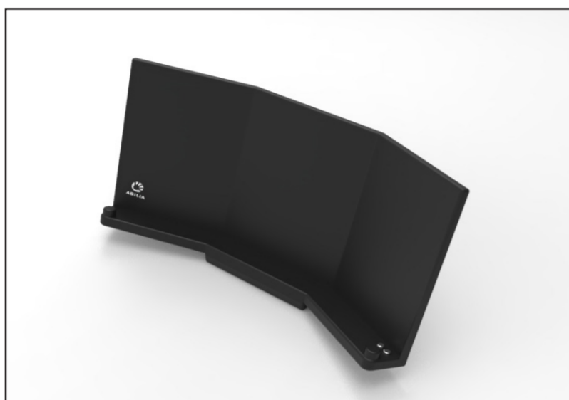
Laddstationen med laddkontakten och loggan.