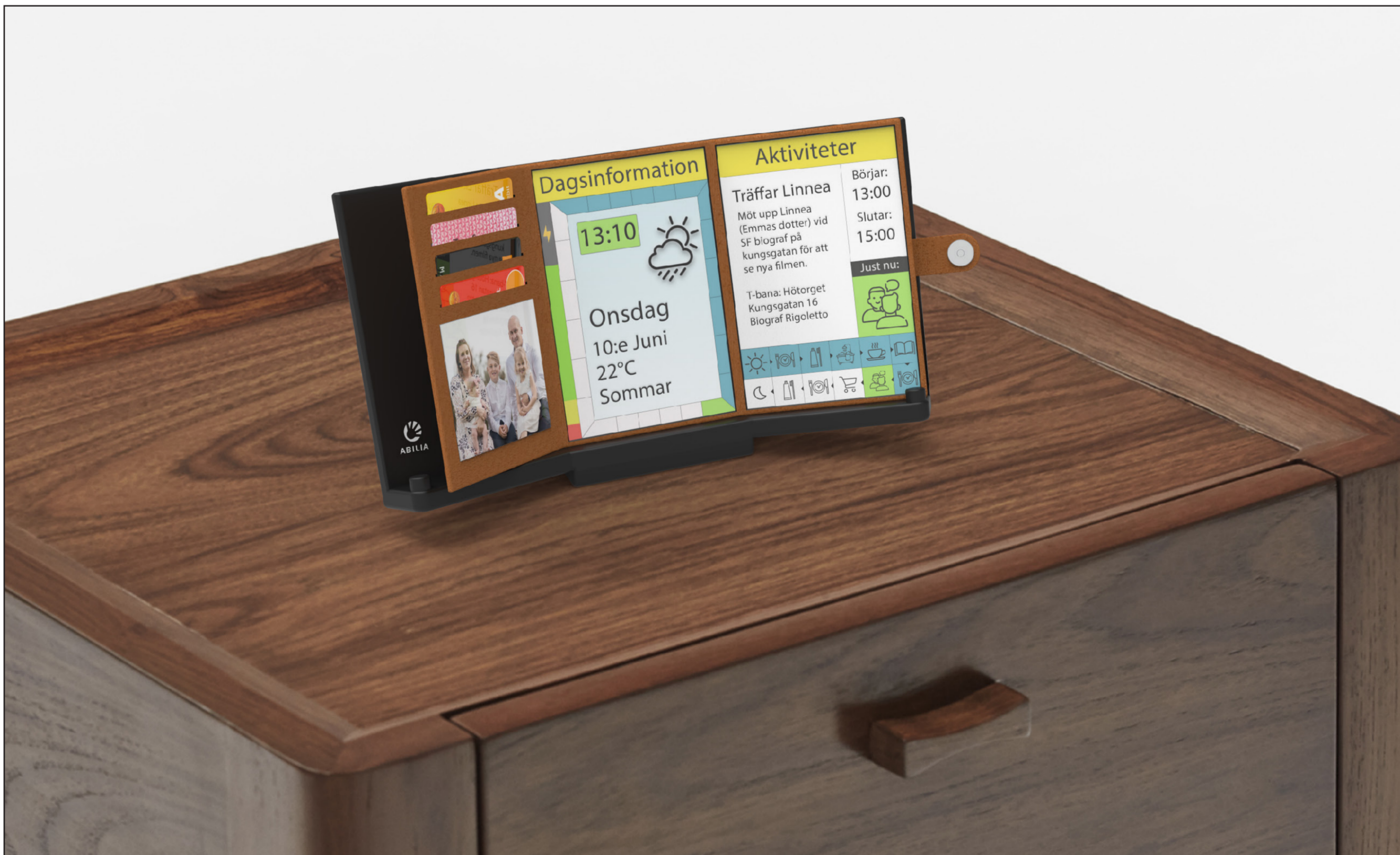
Plånboken fäst i laddstationen i en vardaglig situation.