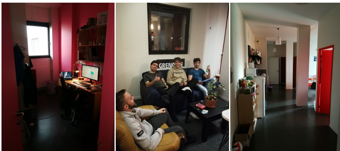
Figure 1: Här är 3 bilder från mitt delade boende. Mitt rum, vardagsrummet och en bild från hallen mot köket.

Det fanns olika boendeformer att söka innan utbytet i Grenoble. Staden har en bred privat marknad som jag inte utnyttjade. Men jag förstod det genom att mina vänner hyrde privat och alternativen verkade vara många. Hur som helst så behövdes i många fall en borgensman (Guarantor) med anknytning till Frankrike genom ett franskt bankkonto. Ett annat mycket enklare alternativ som jag utnyttjade under hela min vistelse i Grenoble var att hyra genom studenthyresföreningen CROUS. Det är en stor förening som hyr ut till studenter i hela Frankrike. I samband med att antagningen till universitetet blir klar så kommer det ett erbjudande via mejl om att hyra en bostad via CROUS. Fördelarna med CROUS är att det är ett enkelt och säkert sätt att göra klart med en bostad innan ankomsten, det är dessutom billigt. Nackdelarna är att bostäderna fördelas slumpmässigt och man riskerar att hamna på ett mindre trevligt boende. Jag hade tur och hamnade på ett bra studenthem som heter "Maison des Etudiants" i centrala Grenoble. Där jag fick dela en stor lägenhet med 3 andra utbytesstudenter. Jag hade aldrig några problem och stannade där under båda mina terminer. Min boenderekommendation är därför att ta ett boende hos CROUS till en början och om det skulle visa sig att det inte blir bra, börja leta på den privata marknaden.