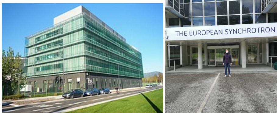
Figure 2: På högra bilden syns Institute de Biologie Structurale där jag gjorde mitt examensarbete. Den vänstra är från entrén till European Synchrotron Radiation Facility som ligger på samma forskningsområde.

Angående exjobbet som jag gjorde på Institut de Biologie Structurale så vill jag utan att gå in för mycket på det säga att det var en kanonupplevelse och rekommenderas stark. Både institutet IBS och deras forskarlag Pixelteam, samt generellt att exjobba i Grenoble. Forskningsinstitutet är många och min upplevelse är att dem skriker efter exjobbare som kan avlasta dem i deras forskningsprojekt.