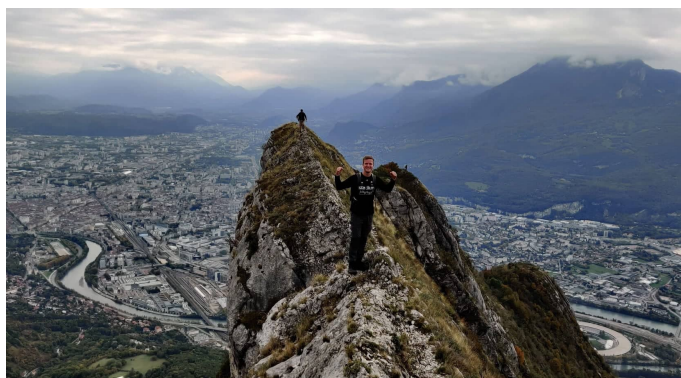
Figure 4: Den här bilden är från toppen av le Néron med staden som bakgrund.

Det franska universitetet erbjuder till skillnad från det svenska universitetet, idrottskurser där studenterna kan prova på såväl nya som gamla idrotter. Här kan man hitta kurser inom allt från rodd, klättring, skidskytte och badminton. Otroligt kul och lätt att få prova på någonting nytt. Vissa av kurserna hade en liten avgift som gick till exempelvis transport till idrottsplatsen eller hyra av utrustning. Men utöver det så var det väldigt billigt och oftast nästan gratis. Tyvärr på grund av situationen med pandemin så kunde jag aldrig delta i någon av kurserna, vilket grämer mig djupt.