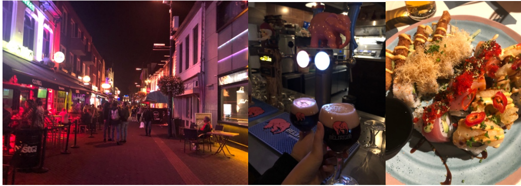
Partygatan i centrala Eindhoven till vänster, bild från baren på det belgiska ölcaféet i mitten och sushi från Down Town Gourmet Market till höger.

Som jag nämnde i mina utgifter så har jag druckit många olika slags öler och ätit mycket mat. Jag har även rest mycket. Under hösten har jag åkt till Paris, Lissabon, Bryssel, Antwerpen, Köln, Milano, Bologna och Chur i Schweiz. Dessutom en rad av städer i Nederländerna. Det har varit superkul att befinna mig i en sådan central plats i Europa där andra länder och kulturer är en tågresa bort. Kan dock inte rekommendera nattbussen mellan Amsterdam och Paris. Skippa den, kort sagt. Eindhoven har även landets näst största flygplats på en kvarts avstånd från stadskärnan med vanlig stadsbuss.