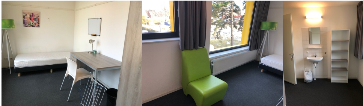
Studentrum på Cederlaan i delad lägenhet.

Jag fick mitt boende via universitetet där de i slutet på juni skickade ut inloggningsuppgifter till företaget Vestide som hyr ut studentlägenheter. Där fick jag bläddra mellan olika rum i delade lägenheter och till slut boka. Jag hamnade i studentbyggnaden Cederlaan i nordvästra delen av staden, även kallad Strijp-S, vilket är det lite coolare och lugnare området med pubar, restauranger och secondhand-butiker. I min mening hade boendet ett ganska dyrt pris med tanke på att både dusch, toalett och kök var delat med andra. Däremot hade mitt rum ett eget handfat, vilket kan verka lustigt först, men ack så praktiskt.