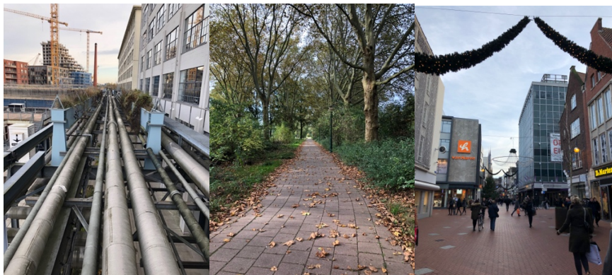
Strijp-S, park och huvudgata i stadskärnan.

Tu/e har ett stort fokus på innovation. Det gäller även för resten av staden som de själva beskriver som en "vibrerande och energifylld stad som spricker av innovation, teknik och design". Företaget Phillips kommer härifrån, vilket är svårt att missa. Gamla industrilokaler finns lite här och var. Många av dem används till andra ändamål nu, som butiker och restauranger, vilket ger staden en urban och såklart industriell känsla. Allt i hela staden ligger inom cykelavstånd och det är alltid full fart på cykelvägarna inne i stan. Det tog ett tag för mig att komma in i tempot. De har ett bra utbud av butiker och restauranger. Runtom i staden finns även parker att vandra runt i.