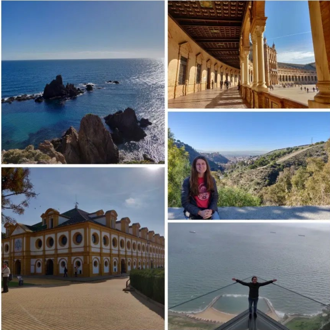
Från roadtrippen i södra Spanien, passade även på att besöka Gibraltar (UK)