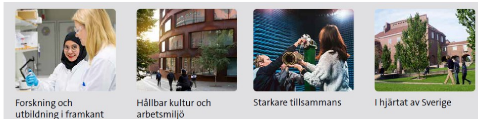
Bild 2. Våra fyra fokusområden

För att förstärka huvudbudskapet mot olika målgrupper använder vi fyra fokusområden som utvecklar och fördjupar huvudbudskapet (bild 2). Fokusområdena tar avstamp i vårt arbetsgivarerbjudande och är till för att skapa relevans i kommunikationen mot olika målgrupper.