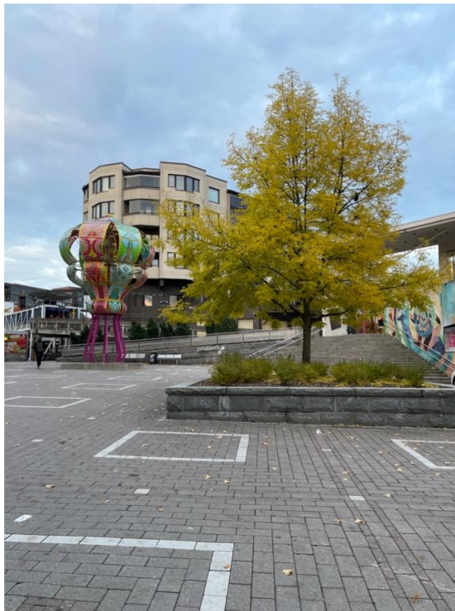
Gamlasgården i Kannelmäki

På fritiden försökte jag hitta på annat än studier med jämna mellanrum, upptäcka staden och så vidare. Jag anser att det var positivt att bo utanför city och campus, eftersom det gav möjlighet till att upptäcka platser man kanske annars inte skulle upptäcka. Jag bodde i Kannelmäki som ligger 15 minuter med tåg utanför stadskärnan.