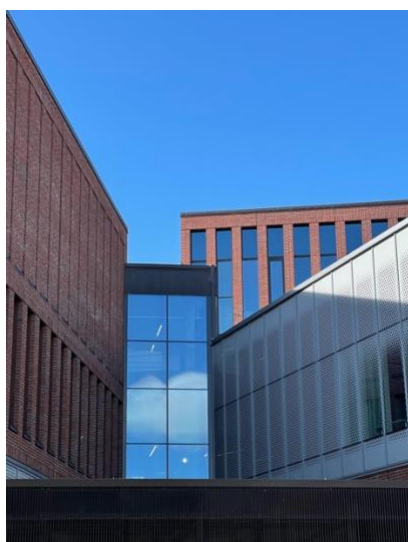
Huvudentrén för Arkitektur, konst och design "Väre"

mycket information inför terminstart, om hur det är att studera på skolan och andra bra tips. Senare på sommaren hörde en fadder av sig till alla utbytesstudenter angående Orienteringsveckan och om ett chattforum där man kunde ansluta sig till för att snabbt få nya vänner eller information. En applikation som kan vara bra att ladda ner inför avresa är Telegram. Där får man