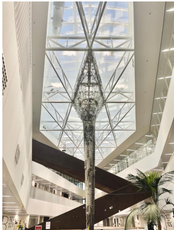
Huvudentrén för Arkitektur, konst och design "Väre" och kommunikation till diverse ateljéer och studierum