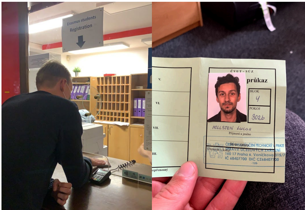
Bilderna ovan visar den smidiga registreringen vid boendet, samt det vackra fängelsekortsliknande identifikationspapper du måste bära för att bl.a visa att du bor i byggnaden.