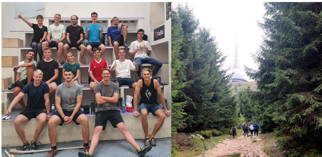
Under de första veckorna organiserades det av oss studenter själva bouldering sessions, vandringar i bergen nära Polska gränsen (intill staden Liberec) ...