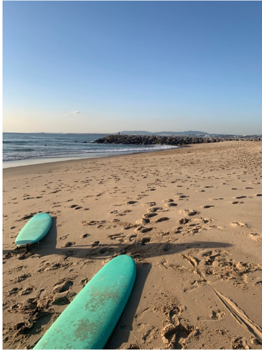
Surf på Caparica

På fritiden passade vi på att gå på event för studenter med Erasmus Life, prova nya restauranger, hänga på stranden, surfa mm. Erasmus Life erbjuder aktiviteter nästan varje dag i form av rooftop events, resor till olika destinationer i Portugal, barrundor osv. Vi valde också att besöka Algarve, Porto, Nazare, Peniche och Azorerna när vi hade en lugnare period i skolan. Det finns så otroligt mycket att göra! Jag spelade som sagt även futsal i universitetslaget, men också fotboll i en lägre "division" på fritiden.