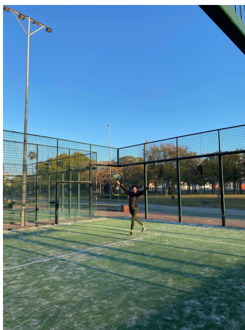
Padel på skolan