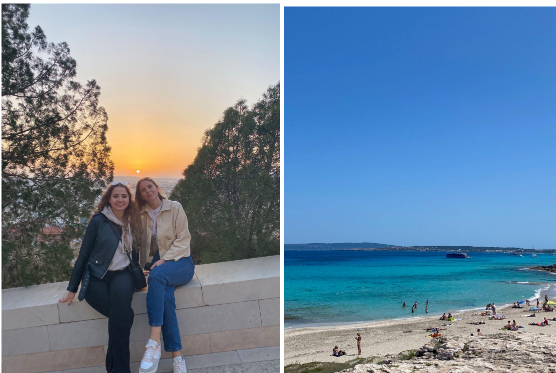
Solnedgång i Alicante och kristallklart vatten på Formentera

Staden är helt fantastisk och människorna trevliga. Har aldrig blivit illa bemött och vill man testa sin spanska i affärer eller på restauranger så uppskattas det! Det är en stad som gillar traditioner och folkfest så om man åker på våren får man uppleva Fallas då alla gator dekorerar med diverse kreationer och fylls med små stånd där man kan köpa churros, mojitos, mat osv. Det hålls små konserter på olika håll i staden och de smäller smällare samt fyrverkerier mer eller mindre dygnet runt. Många passar på att resa runt i landet och Erasmus/ESN arrangerar resor till städer som Marocko, Ibiza, Barcelona, Madrid osv. Många reser dock på egen hand när det passar. Jag hade redan varit en del i Spanien innan jag kom till Valencia så jag fokuserade mest på att njuta av tiden i Valencia men åkte en sväng till Alicante (2h med tåg), Ibiza/Formentera samt till Montanejos på festival. 30 minuter med buss från Valencia ligger Albufera där man kan äta god paella och se fina solnedgångar.