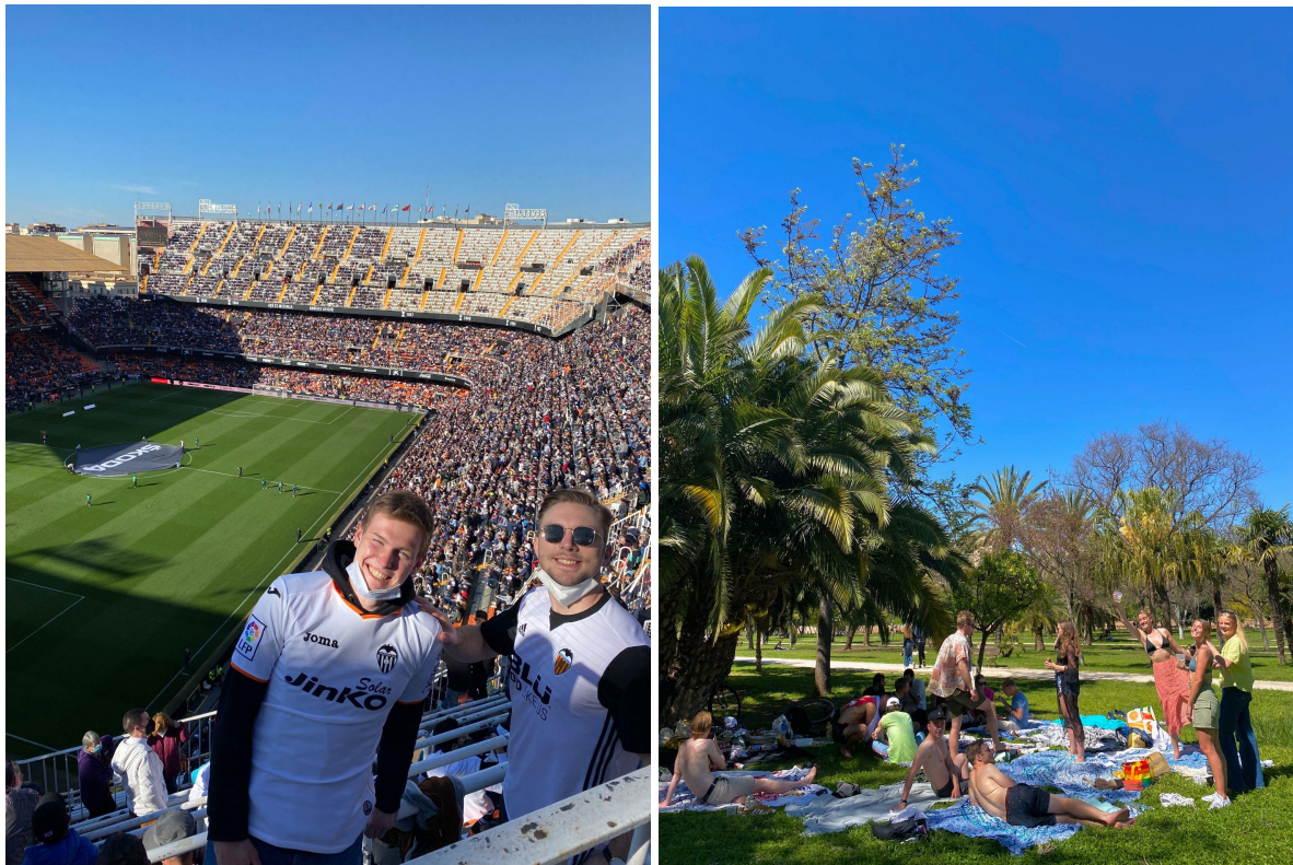
Valencia vs Barcelona samt födelsedagsfirande i Turia parken.

Det finns en del klubbar att gå ut på, min favorit var “Marina Beach Club” men “Mya”/”l’Umbracle” är också bra! Vill man njuta av livemusik så rekommenderar jag “Radio City” och “La Fabrica de Hielo”. Utöver det kan man gå och se fotboll på “Mestalla” och vi hann med tre fotbollsmatcher, arenan är häftig så det rekommenderas starkt!