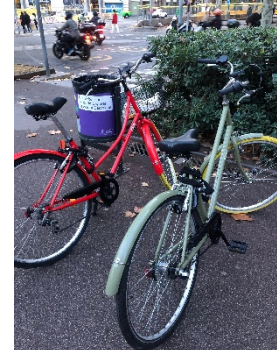
Campus julgranen och på väg mot biblioteket och cykeln som underlättat livet under hösten.