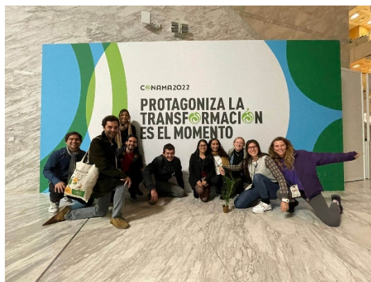
Gruppen från konferensen.

Jag valde att flyga ner men det går jättebra att ta sig till Barcelona med tåg. Väl framme var det väldigt enkelt att göra hållbara val kommunaltrafik var halva priset eller gratis så jag kunde resa runt i Katalonien väldigt billigt. Universitet uppmuntrar också till hållbarhet genom olika events, sortering och de har även en instagram kring olika hållbara projekt där de sker massa spännande. Via universitet fick jag även tillgång till att åka på Spaniens nationella hållbarhetskonferens under en veckas tid (En av mina bästa upplevelser i Spanien!) och de erbjöd även andra resor med hållbarhetsfokus inom kurserna på masterprogrammet. Barcelona är också rankad som en av de bästa veganvänliga städerna och secondhand är stort i stan också så det är lätt att göra mer hållbara val i vardagen.