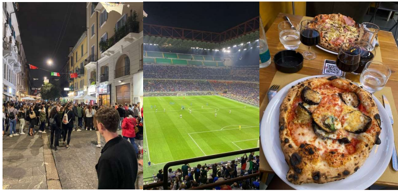
China-town, fotbollsmatch och pizza