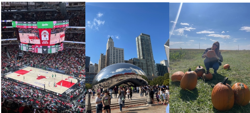
Vänster: NBA match, Mitten: The Bean i Chicago, Höger: Omringad av pumpor på Pumpkin Patch!

Det finns många studentorganisationer i UIUC, något för alla! Jag gick med i Illinois Solar Decathlon vilka är med i en tävling anordnat av USA:s energidepartement, med syfte att bygga ett net-zero familjehus med solpaneler. Jag gick även på event som anordnades av OctoberLovers där vi bland annat åkte ut på Pumpkin Patch och gick på Barn Dance. På fritiden umgicks jag med vänner jag lärde känna där. Vi åt oftast middagar tillsammans och testade på skolans olika pubar. Dessutom köpte vi säsongskort och kollade på amerikansk fotboll vilket var väldigt kul. Kollade även på annan sport såsom basket, fotboll, ishockey och volleyboll. Vi åkte också upp till Chicago för att turista och kolla på en NBA-match mellan Chicago Bulls och Boston Celtics. Firade även Halloween och Thanksgiving! Thanksgiving sammanföll under Fall Break så vi bestämde oss för att åka till New York och Boston för att turista och jag träffade även min släkt där. I början av terminen besökte vi även Nashville i Tennessee!