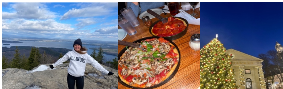
Vänster: Vandring i New Hampshire!, Mitten: Deep Dish Pizza, Höger: Julkänsla i Boston!