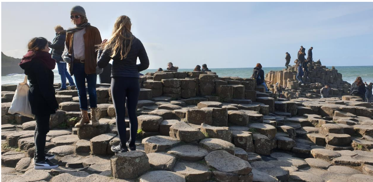
Figur 10 Helgresa till Belfast och även Giant's Causeway. I Nordirland. I april.

Under terminens gång så gick åkte jag på en del extra hikes med människorna jag umgicks med. Vi var även ett gäng som åkte på en helgresa till Belfast. Terminen är annars intensiv men slutar väldigt