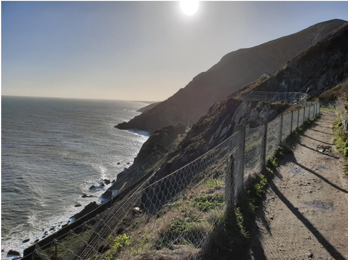
Figur 2 En schysst stig vid ett ställe som hette Graystone, i januari

En introduktionsföreläsning hölls vid Trinity College under torsdagen följande vecka. Den följdes av en uppdelning i mindre faddergrupper och en halvhjärtad introduktion till Irland och Trinity College.