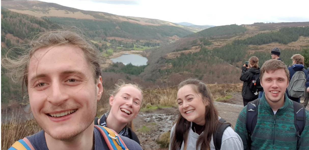
Figur 4 Bild från en mysig hike i Wicklow Mountains. 1 februari.

Skolan är fin, lokalerna är helt okej. Alla studenter får medlemskap på ett bra gym och simhall som ligger på campus och det finns många olika studentföreningar man kan gå med i.