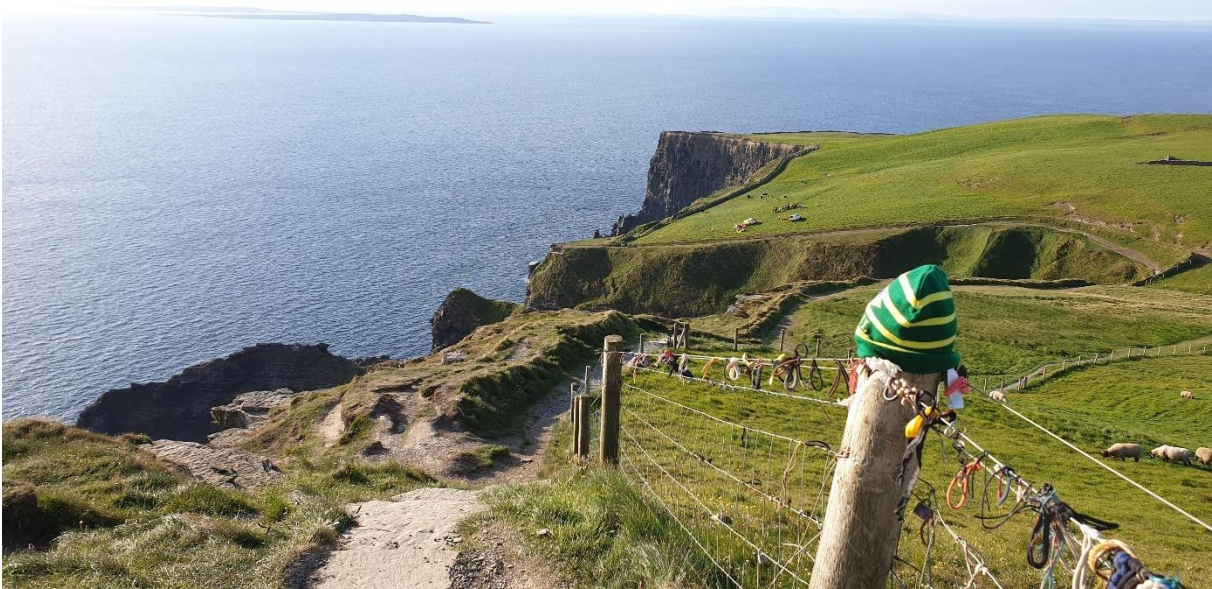
Figur 7 Bild jag tog när jag var ute och sprang längs Cliffs of Moher. I fjärran syns Aran Islands. 1 maj.

Dublin är ganska grått, trafikerat och stökigt. Det är väldigt mycket turister. Det man gör i själva staden är att gå på pub och umgås med människor. Om du inte är rädd för att dö i trafiken så rekommenderar jag att köpa en cykel, då var man enkelt flexibel och kunde röra sig väldigt fritt över hela staden. Det är egentligen en ganska liten stad, och det fanns ingenstans dit det inte var cykelavstånd. Irland är istället väldigt grönt som du säkert har hört, men det kan vara svårt att ta sig ut på landsbygden om man inte har bil. Om man kommer till Irland från Sverige kan man uppleva att allt är lite sämre, saker fungerar inte och ingen passar tider. Det kunde vara lite jobbigt vid grupparbeten i skolan men var inget man led av annars. Man vänjer sig ganska fort.