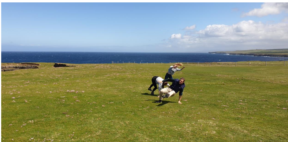
Figur 12 Lite dans vi Downpatrick Head. En av de sista dagarna på Roadtrippen och i Irland. 1 maj.

Ärligt talat så känner jag inte att Irland var så fantastiskt men jag hade en underbar tid ändå, främst tack vare fantastiska människor jag träffade. Jag tror dock att det kan vara en speciell sorts människor som söker Erasmus/utbytesstudier på Irland, för jag tror inte att det är ett land som alla överväger, och kanske var det därför det blev så himla bra. Jag uppmuntrar dig därför att söka Irland ändå, det blir jättekul och är nära hem om du skulle ångra dig.