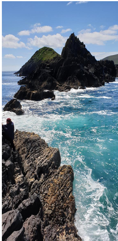
Figur 3 Sybil Head, The Ring of Beara, i närheten av Dingle. Där hade de bland annat spelat in en av de nyare Star Wars filmerna. I maj.

Till sist vill jag varna för att man på Irland i regel bor mycket sämre än Sverige. Husen är ofta skruttiga och kalla. Det är standard att klampa in på heltäckningsmattorna med sina ytterskor och flera av de hus jag besökte när jag cyklade runt och kollade på boenden var väldigt stökiga/ostädade. Kanhända hade jag bara otur.