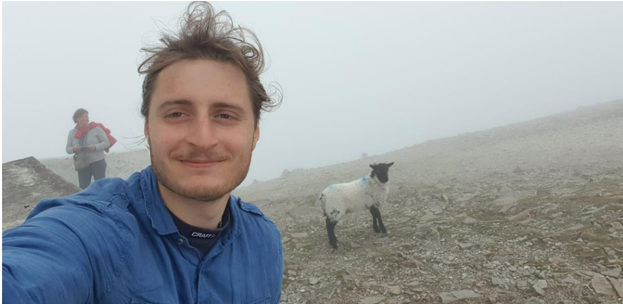
Figur 1 Jag på Irland, uppå ett berg som hette Croagh Patrick. 1 maj.