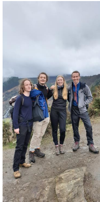
Figur 9 Hike i Wicklow Mountains.

En bra sak med skolan var att det fanns massor av olika studentföreningar. Den bästa tycker jag var Hiking Society som nästan varje helg gick ihop och hyrde en buss för att åka på Hike i Wicklow Mountains utanför Dublin! Det kan jag verkligen rekommendera eftersom det som sagt är svårt att komma ut i naturen om man inte har tillgång till en bil eller dylikt. Jag deltog även sporadiskt i Debating Society där man fick debatera mot varandra som de gör i brittiska parlamentet, och jag råkade av misstag gå med i Arabian Society eftersom de bjöd på kaffe i en lokal varje måndag.