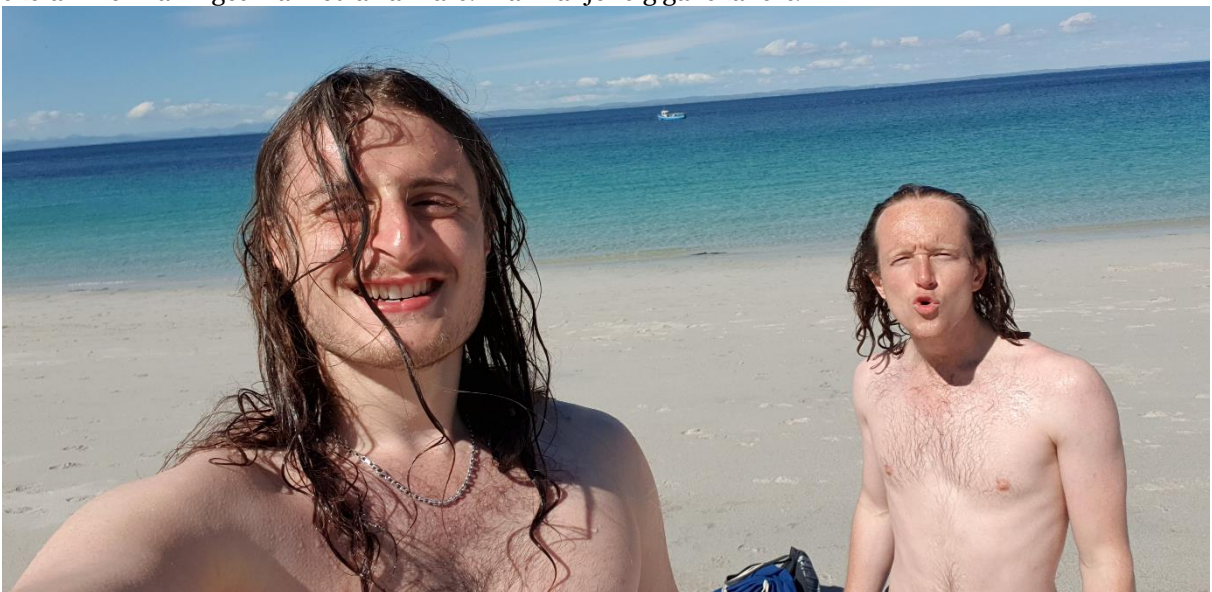
Figur 8 Jag och en kompis när vi badade i Atlanten. 1 maj.

Dublin är ganska grått, trafikerat och stökigt. Det är väldigt mycket turister. Det man gör i själva staden är att gå på pub och umgås med människor. Om du inte är rädd för att dö i trafiken så rekommenderar jag att köpa en cykel, då var man enkelt flexibel och kunde röra sig väldigt fritt över hela staden. Det är egentligen en ganska liten stad, och det fanns ingenstans dit det inte var cykelavstånd. Irland är istället väldigt grönt som du säkert har hört, men det kan vara svårt att ta sig ut på landsbygden om man inte har bil. Om man kommer till Irland från Sverige kan man uppleva att allt är lite sämre, saker fungerar inte och ingen passar tider. Det kunde vara lite jobbigt vid grupparbeten i skolan men var inget man led av annars. Man vänjer sig ganska fort.