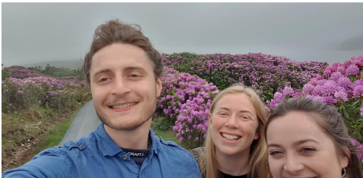
Figur 11 Massa snygga blommor i Connemara. 1 maj.

tidigt. Då hann vi med att åka en vecka till en killes sommarhus i Frankrike, samt göra en två veckors roadtrip runt nästan hela Irland. Jag kan varmt rekommendera att roadtrippa i Irland, då kan man åka The Wild Atlantic Way som går längs hela västkusten och besöka landets många nationalparker. Västkusten är skitfin, glesbefolkad och väldigt annorlunda från östkusten och Dublin. Det krävs dock att någon i umgänget är 25 år eller äldre för att man ska kunna hyra bil på Irland.