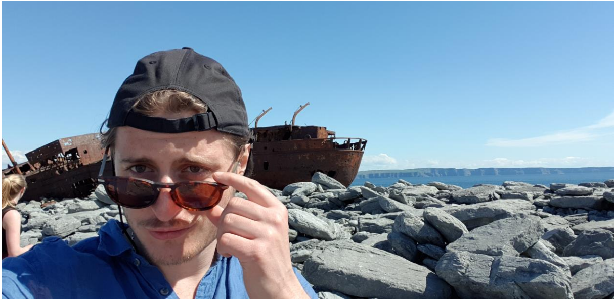
Figur 5 Jag med ett snyggt vrak i bakgrunden ute på Aran Islands. Ytterligare i bakgrunden kan man se Cliffs of Moher. I maj.

CS3BC1 e-BUSINESS I. En jättesnäll, men riktigt (alltså extremt) snurrig lärare. Jag slutade att gå på de osammanhängande föreläsningarna och läste istället själv på kursmaterialet och gjorde uppgifterna. Examination bestod av ett stort grupparbete och en stor slutuppsats (6000 ord), som förväntades vara som ett litet kex-jobb.