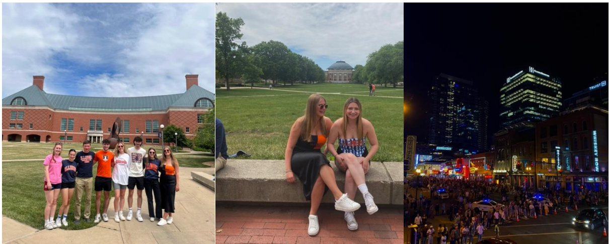
Vänster: På Engineering Quad med mina vänner från Irland, Mitten: På Main Quad med en av mina roomies, Höger: Broadway i Nashville