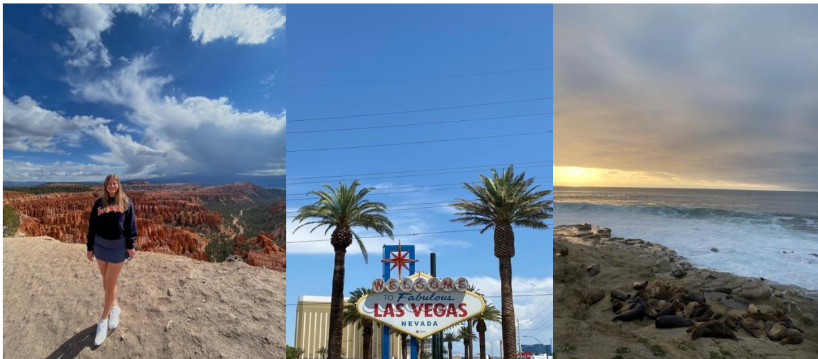
Vänster: Bryce Canyon i Utah, Mitten: Den berömda Las Vegas-skylden, Höger: Sjölejon-spaning i San Diego

Jag hade verkligen en otroligt bra termin på UIUC. Jag rekommenderar varmt att åka på utbyte! Oavsett vart. Det är en fantastisk möjlighet och du kommer växa så mycket på den korta perioden. Det är stressigt i början med alla förberedelser men du är inte ensam och allt kommer att lösa sig. Jag var ett kontrollfreak innan jag åkte men utbytet har verkligen hjälpt mig att släppa på kontrollen. Du kommer skapa så många minnen! Mitt bästa tips är att våga ta kontakt med människor. Det är relationer du kommer ha för livet och det är så himla kul att ha lyxen att ha vänner överallt i världen att hälsa på.