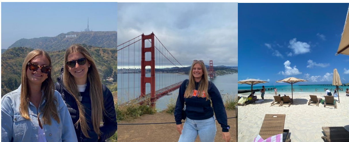
Vänster: Hollywood-skylden i bakgrunden i Los Angeles, Mitten: Golden Gate bron i San Fransisco, Höger: På stranden i Cancun, Mexico under Spring Break