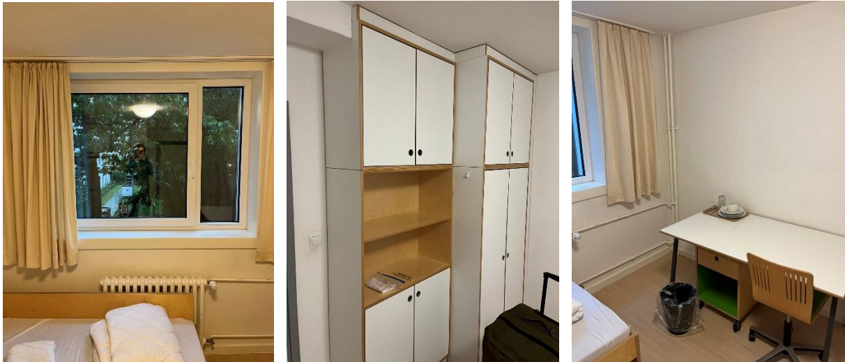
Boendet i Gustav-Radbruch-Haus