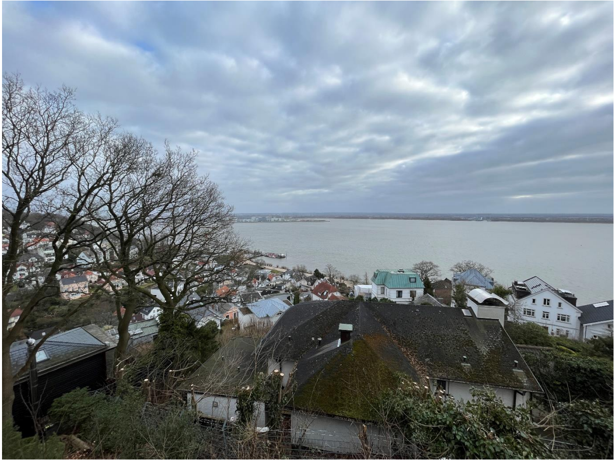
Treppenviertel Blankenese, en grå dag i Mars

Jag har besökt Tyskland en hel del tidigare, men just Hamburg betydligt mindre. Jag kunde därav inte riktigt uppleva några tydliga kulturkrockar. Studenter som grupp har en tendens att vara öppna, och de tyska studenterna är kanske ännu mer öppna för nya bekantskaper än de svenska (särskilt om man kommer från Sverige, ett land som näst intill alla jag träffade har besökt och tyckt om). Om man inte är van vid den tyska kulturen är det ett par saker man får vara redo för. Tyskland är ett statussamhälle långt mer än Sverige. Man ni:ar („sie“ vs „du“) personer fram tills de ber en att inte göra det, särskilt märkbart är det i samband med inköp, men även professorerna på universitetet.