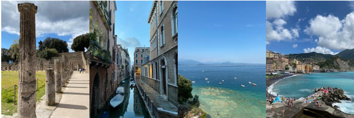
Pompeji, Venedig, Gardasjön (Sirmione), Camogli

platser ca 1 timme bort (Bergamo, Brescia, Monza, Cremona, Pavia, Piacenza, Comosjön, Gardasjön), ca 2 timmar bort (Genua, Torino, Venedig, Florens) samt åka på en längre resa över påsk till Neapel (med nattbuss). Tågbiljetter är ofta ganska billiga och det är lätt att boka och resa med apparna Trenitalia och Trenord. Kortare tågresor har ofta ett fast pris men som student finns det även billigare tåg/bussbiljetter vid längre resor, både med Trenitalias Cartafreccia, PoliMis welfare-rabatt på Trenitalia och med ESN-kortet.