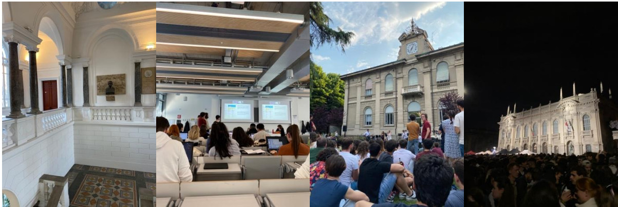
Inuti huvudbyggnaden, under en presentation, elevkonsert på campus, fest på Piazza Leonardo

Jag skulle rekommendera att välja kurser så att de upptar max 4 dagar i veckan för att ha mer tid att upptäcka staden och landet. Jag valde att läsa en kurs som non-attending student. Mitt schema bestod därefter av kurser från 13–19 tre dagar i veckan och 14–18 en dag i veckan. Att sluta vid 19 var väldigt ovanligt och jobbigt i början av terminen, men efter ett tag vände jag mig någorlunda vid det och många veckor gick det att gå tidigare. Man måste generellt närvara på 70–80% av lektionerna för att få godkänt men jag vet inte hur noga det är. I vissa kurser får man skriva under ett papper, i några har kursassistenterna koll på vilka som är där och i andra är det inte någon som har koll över huvud taget. Generellt så verkar det inte finnas något system för raster som på KTH utan läraren kan i bästa fall ge en rast efter två timmar eller när de känner för det. Inte ens under långa dagar med presentationer var det mer än 10 minuter rast någon enstaka gång. Det blev särskilt jobbigt framåt sommaren i klassrum utan AC.