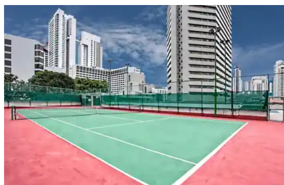
Vårt boende: Far East Plaza Residences