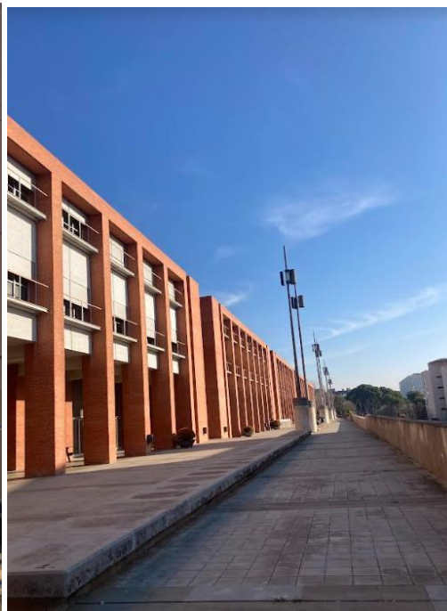
Byggnad för klassrum