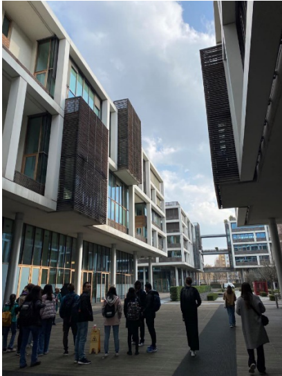
Besök i området där projektet i Urban Design var.

utgjorde den större delen. Därav skulle jag inte rekommendera den här kursen. Professorn var inte nödvändigtvis dålig men hans kommunikation med assisterande lärare var det. Dessutom gav han inte ut datum för tentan förens veckan innan.