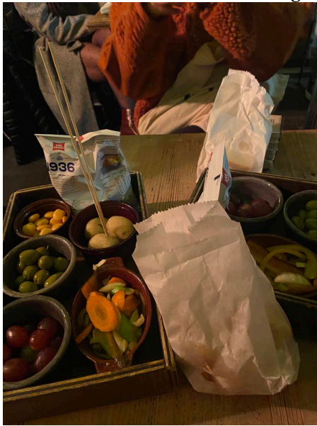
Apertivo i Porta Venezia.

m var det nära till lokala restauranger, matbutiker och kollektivtrafik och området kändes aldrig dött.