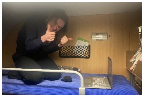
Figur 7 Jag i överslafen på SJ:s nattåg till Hamburg.

Det gick bra att resa hållbart till universitet, alla cyklar! Bussar finns också, och tåg om du bor i en annan stad. Universitet införde Billie Cups under min vistelse, de kostade 1€ och återanvändes sedan (eller lämnades tillbaka till kaféet) och de tog därmed helt bort alla engångsmuggar till kaffe. Det märktes på det sättet att de tänkte på miljön, men det är svårt att veta vad de gör på en större skala. De hade bra vegomat på universitet. De har ett Green Room där de har event, bl.a. i början av terminen gav de bort saker som studenter som slutat donerat, där tog jag tre koppar till min lägenhet. Jag hade inga fysiska kursböcker utom i Nederländska vilken jag köpte av en bekant.