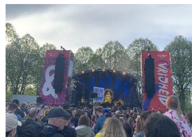
Figur 4 Gratis festival i vackra grannstaden Den Bosch under Liberation day