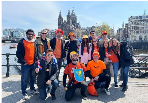
Figur 5 Kingsday i Amsterdam

På TU/e är det event hela tiden vilket var jättekul, bl.a. små festivaler var och varannan vecka som ofta var gratis. TU/e har tyvärr inget Erasmus Student Network (ESN) vilket egentligen är en stor nackdel. International Association Cosmos anordnar många roliga event, men jag har hört om städer i Europa där t.ex Erasmusstudenter har en egen bar, och mycket aktiviteter hela tiden. Men man kan gå på andra städernas event, t.ex Breda och Tilburg, eller åka på resor med yes-trips. Det gjorde jag och mina vänner under Nederländernas stora högtid Kingsday, då vi campade med yes-trips i Amsterdam. De flesta av mina vänner träffade jag tidigt i början av utbytet, två på facebook redan innan t.o.m, också på introductory day, genom vänners vänner eller på föreläsningar. De internationella är ofta väldigt öppna, och det är lätt att prata med många på event.