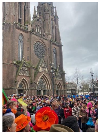
Figur 3 Carnival med Sint Catharinakerk i Eindhoven.