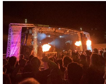
Figur 6 Gratis festival med fyra konserter en torsdag på campus.