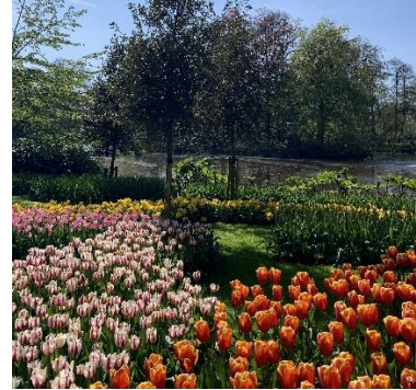
Figur 9 & 10 Tulpaner i Keukenhof.