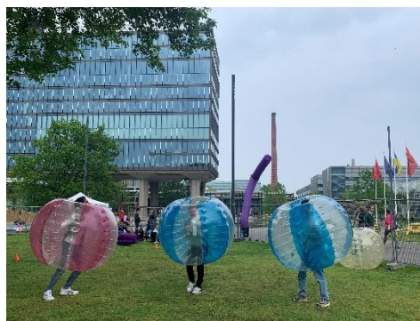
Figur 1 Bild från en minifestival på campus med konsert och aktiviteter. I bakgrunden syns Atlas-byggnaden vilket är en utav huvudbyggnaderna där jag hade mycket föreläsningar.

ingenjörsområden. Jag läste alla kurser på engelska. Språkkurser erbjöds, jag läste 2ECTS motsvarande A1 i Nederländska i Q4. Under en vanlig dag kanske en föreläsning startade 08:45, många av mina föreläsningar var väldigt interaktiva och man förväntades ha gått igenom material inför dem. I Deep Learning kunde det vara att frågor gick igenom på research papers man förväntats ha läst, i Financial mathematics och Time series analysis and forecasting kunde det vara att vi skulle programmera en liten kod inom ämnet. Lunch 12:45-13:30, fanns 3 lunchställen med priser 4-7€. En mikro i biblioteket, och en mikro per association. Jag satt i biblioteket med vänner när jag inte hade föreläsningar eller övningstillfällen (som i machine learning och deep learning endast var för att ställa frågor, medan i financial mathematics och time series föreläsningarna var snarare övningstillfällen, fast man gör uppgifter själva och de går igenom teori och kanske någon uppgift). Efter skolan kanske jag gick på ett yogapass på sports centre, tog en öl på studentbaren Hubble, eller satt sent i biblioteket fast på en inlämningsuppgift. Undervisningen skiljer sig en del från KTH. Nästan alla kurser är 5hp, därav läser du 3 kurser per period. De har också väldigt annorlunda system för poängsättning av inlämningsuppgifterna. Campuset var också annorlunda, väldigt modernt och fint!