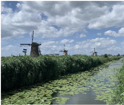
Figur 8 Väderkvarnar i Kinderdijk

Det är bra att registrera sig hos stadshuset tidigt och sedan att få ut sitt DigiD vilket är en slags onlineidentifikation, vilket behövs för att t.ex registrera dig hos en husläkare. Även om du bara är där i fem månader så kan man behöva gå till en vårdcentral oväntat, och jag vet flera som åkte till närakuten där de skickade hem dem och hänvisade dem att besöka deras husläkare.