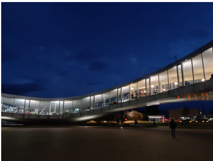
En del av Rolex Learning Center på kvällen. Byggnaden ska likna en skiva schweizisk emmentalerost.

En sak jag inte tyckte om var att antalet studieplatser på campus var långt ifrån tillräckligt, och bidrog till att allt för mycket tid lades på att gå runt och leta efter en plats att sitta på. Även om Rolex Learning Center är en häftig byggnad så var det flera gånger det inte fanns en enda studieplats i hela byggnaden, allra värst på onsdagar av någon anledning. Möjligtvis beror det höga trycket på att biblioteket där är öppet för vem som helst och lockar många studenter från det intilliggande universitetet UNIL. Ett tips är att använda EPFL-appen där man lätt kan se vilka föreläsningssalar och övningssalar som är lediga och välja plats utefter det. Ett annat alternativ är så klart att gå upp tidigt och vara på plats i skolan tidigt. Själv är jag en kvällsmänniska som föredrar att sitta uppe sent och plugga och var därmed oftast inne på campus vid 10-tiden på förmiddagen, dvs då det redan var fullt.