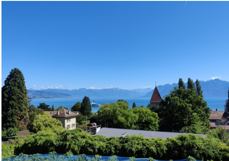
Vy över Genèvesjön från Saint Sulpice, ca 10 min gångavstånd från EPFL

När jag skulle välja universitet för min utbytestermin så ville jag helst stanna i Europa på grund av möjligheten att relativt smidigt åka och hälsa på i Sverige under utbytet. Jag har också alltid velat bli bättre på franska sedan gymnasiet och därför stod valet först mellan Frankrike och Belgien, men upptäckte kort därpå att KTH har utbyte med EPFL, som ju ligger i den franska delen av Schweiz. Landet Schweiz hade jag aldrig varit i tidigare och jag hade heller inte spenderat särskilt mycket tid i bergiga miljöer som Alperna. Detta kombinerat med att jag hade hört gott om EPFL fick mig att snabbt välja det som förstahandsval. Även om Schweiz inte är med i EU så krävdes det inte särskilt mycket pappersarbete innan ankomst, såsom visum eller liknande. Dock var det en del papper som behövdes fyllas i efter ankomst. Mer om det senare.