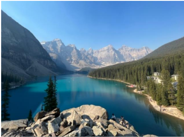
Valley of the Ten Peaks, Banff