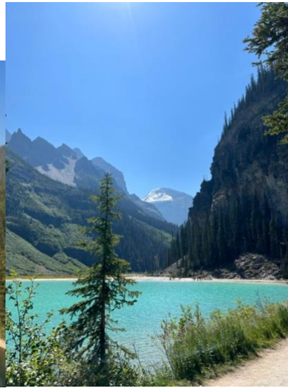
Lake Louise, Banff