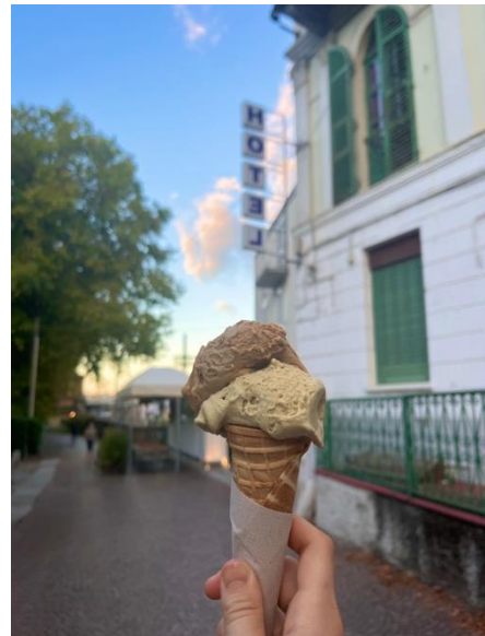
Bild 1 - En gelato med smak av pistage samt lakrits från Calabrien, i staden Ivrea som ligger 1h bort med tåg från Turin.

I ärlighetens namn har jag aldrig varit särskilt intresserad av utbytesstudier – jag kände mig inte helt bekväm med att flytta själv utomlands med allt vad det innebar. När jag sedan insåg att det var sista chansen för utbyte under sista året av mastersstudierna bestämde jag mig för att åka. Varför det blev Italien berodde främst på matkulturen – jag har både arbetat med glass och som barista och äter gärna en gelato så fort jag får chansen. Jag har inte blivit besviken i Turin, här finns både baristor och gelaterior av hög kvalitet! (Se mina bästa tips under avsnittet fritid och social aktiviteter.) Ännu en anledning till valet av Turin är att det är en mindre stad (jämfört med Milano) med mycket grönska och många studenter. Eftersom jag är från Sverige krävdes inte mycket förberedelser. Det viktigaste var att i Sverige ansöka om Fiscal Code på italienska ambassaden i Stockholm via brev (skickades in i juni, men rekommenderar att ansöka så fort du har fått utbyte godkänt samt att ej ansöka om själva kortet utan bara koden).