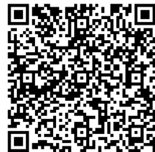
Pitch text document