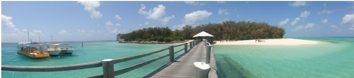
Fältresa till Heron Island.

En mycket intressant och lärorik kurs i marinbiologi som inte krävde några förkunskaper. Framförallt fältresan till Heron Island, en svårtillgänglig liten korallö i Stora barriärrevet, var helt fantastisk och min höjdpunkt på hela resan! Det var fem fullspäckade dagar med mycket snorkling (såg bland annat sköldpaddor, hajar och stingrockor), alltid med kunniga och entusiastiska lärare i närheten som förklarade och beskrev vad man såg. Det var väldigt många utbytesstudenter i denna kurs och även här fann jag många nya vänner, så kursen rekommenderas varmt!