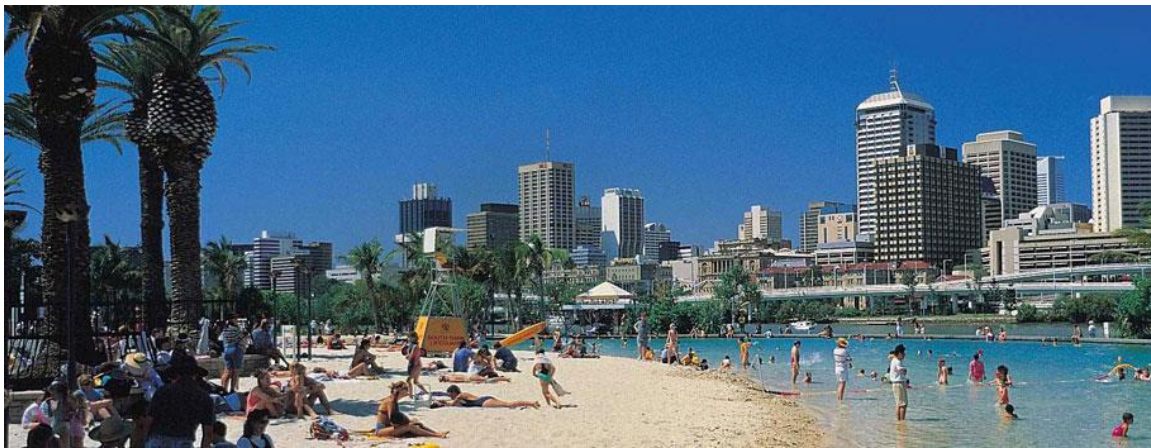
South Bank, anlagd citystrand med pool.

End/Highgate Hill, syns delvis längst ner på kartan) – stadsdelen där UQ ligger. Jag bodde tillsammans med en god vän och kursare från KTH som pluggade vid Queensland University of Technology under samma tid, samt hans fru. Då hans termin startade tidigare än min så fixade de vårt boende under veckan innan jag anlände och jag fick lyxen av att ha boende klart när jag kom dit. De hittade vår lägenhet via http://www.realestate.com.au/rent/ , men annars så kan nog https://uqrentals.com.au/ vara en bra tjänst (UQ:s egna). Vi bodde i en trerummare på 8 Cordelia street vid South Brisbane, vilket vi fick betala 600 AUD/vecka för. Det är ganska mycket men gick bra då vi delade på tre, att det fanns pool i huset var också ett riktigt plus! Läget var jättebra då det var ganska nära till både West End, South Bank med en anlagd citystrand och CBD, samt bra kommunikationer till skolan med buss 66 från Cultural Centre till UQ lakes. Hade jag inte bott i South Brisbane så hade jag nog personligen velat bo i West End just på grund av att det är nära både skolan och city samt har väldigt mycket att erbjuda som stadsdel.