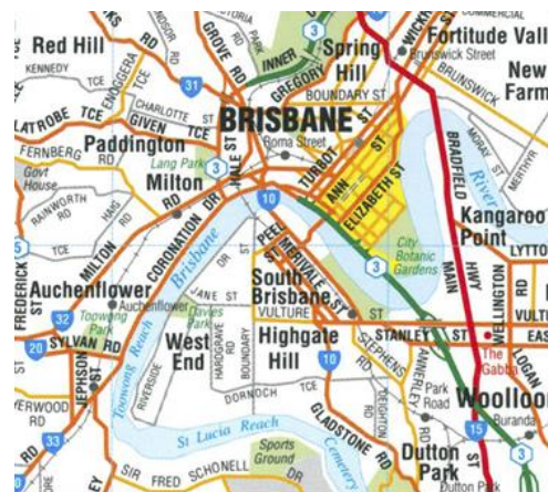
Centrala Brisbane med stadsdelar.

Brisbane är en fin stad med ca 2 miljoner invånare, belägen vid Australiens östkust. Staden har utvecklats kring den meandrande Brisbane River och har ett härligt, subtropiskt klimat. Områden som kan vara bra att ha koll på är CBD (Central Business District, gulmarkerat i kartan) – stadens centrum med shopping och massa skyskrapar, Fortitude Valley (nordost om CBD) – området med alla nattklubbar, South Brisbane (syd om CBD) – mycket kultur med diverse museum och fina restauranger längs South bank, West End (sydväst om CBD) – hippt, ännu ganska så oexploaterat område med coola barer och restauranger, St Lucia (syd om West