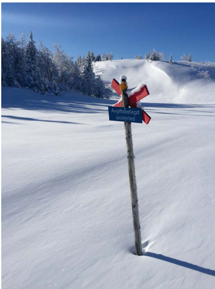
Figur 6. Avgiftsbelagd skoterled.