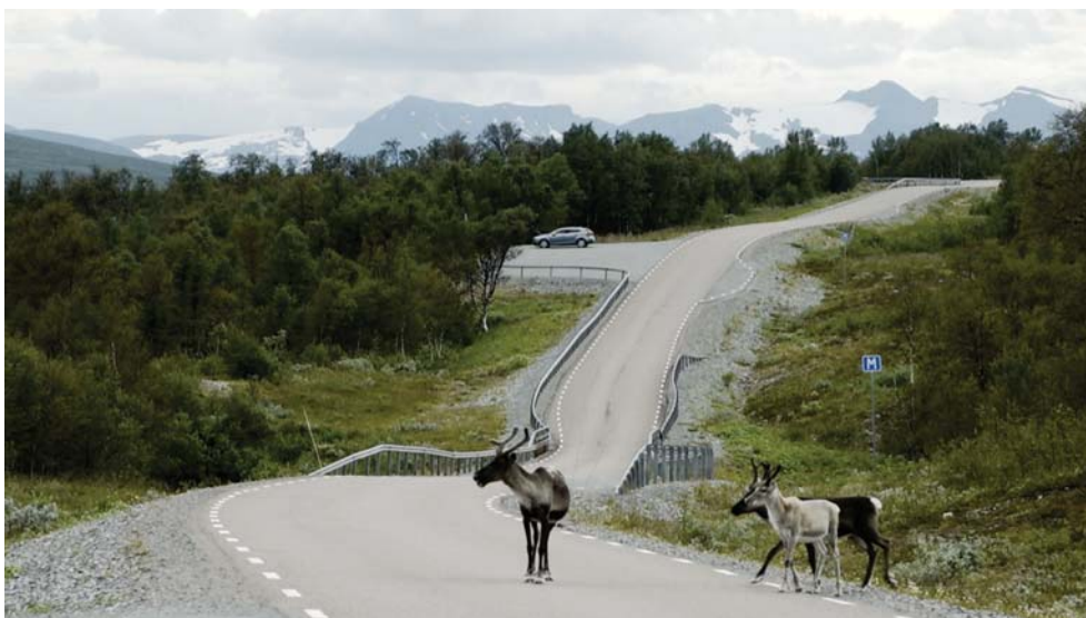
Figur 7. Vägen som ökat tillgängligheten.