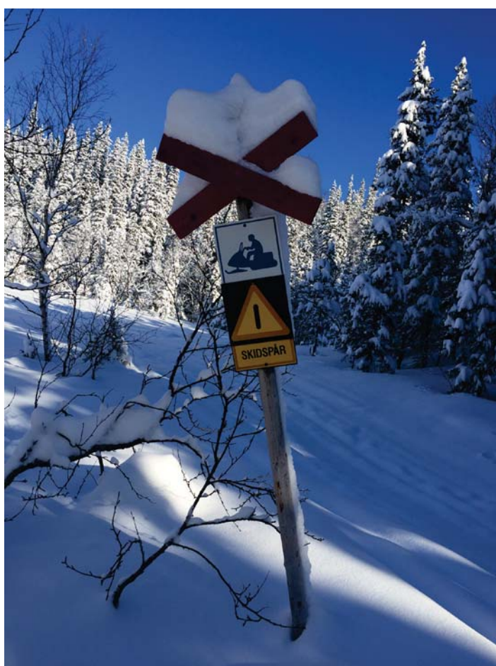
Figur 4. Skyltning om olika aktiviteter.

Fjällens aktörer diskuterade under workshopen de framtida utmaningar som inkluderar nya former av rekreation, konflikter mellan intressen, ledkvalitet, påverkan på växtlighet, samt en minskad kunskap om säkerhet i fjällen bland besökare. Ett antal möjliga förbättringar i det gränsöverskridande samarbetet mellan Sverige och Norge skulle kunna innebära, till exempel en gemensam skylt- och informationsdesign, marknadsföring och bokningssystem.