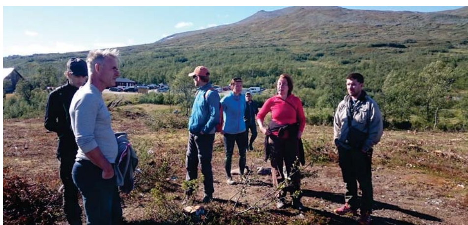
Figur 3. Fältarbete: Forskare i samtal med några av fjällens aktörer, augusti 2016.

Forskningsprojektet har använt flera olika vetenskapliga tillvägagångssätt för att samla det material som utgör projektets resultat. Forskningen har sin grund i samhällsvetenskapliga och humanistiska metoder, arbetssätt och datainsamlingstekniker. Här nedan listas kortfattat hur vi gått tillväga med att