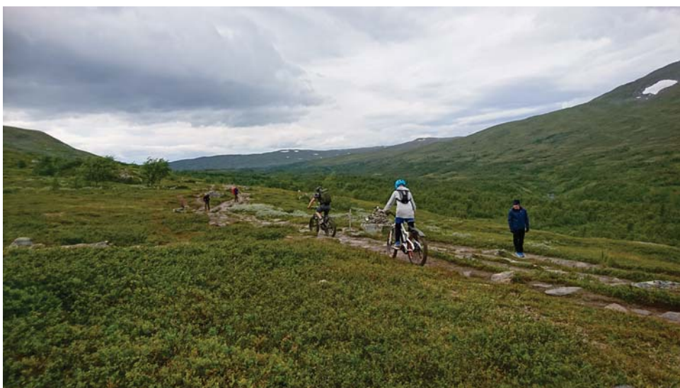
Figur 5. Cyklister och vandrare.

Det är också intressant att notera att ingen av de 195 granskade artiklarna hade en tydlig definition på vad en led är. Det framstår som att "led" är ett begrepp som tas för givet och att ingen definition eller förklaring är nödvändig. Dock utförs forskning om leder i flera olika länder och det skulle vara intressant att undersöka om det finns kulturella skillnader kring vad som ingår i begreppet "led".