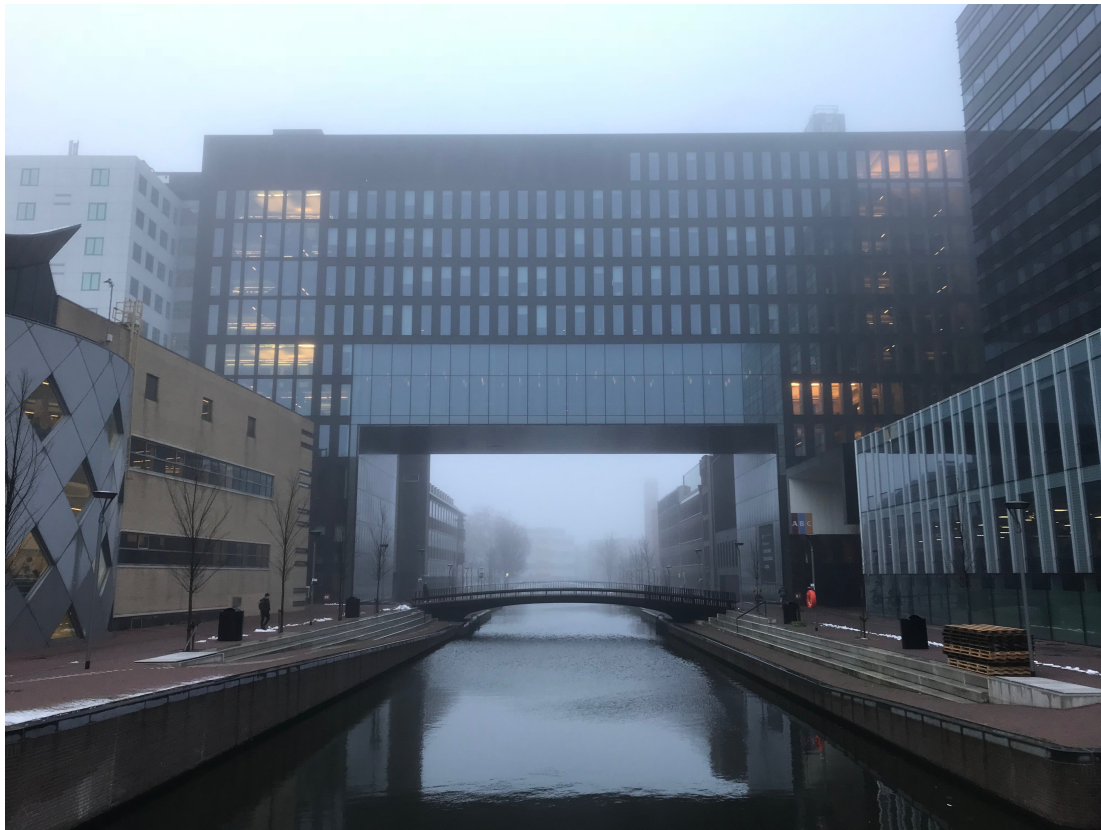
University of Amsterdam, Roeter campus.

Jag reste till Amsterdam den 16:e augusti vilket innebar att jag hade cirka tre veckor att landa i mitt boende och staden innan studierna vidtog. Jag deltog i den internationella mottagningen för utbytesstudenter på Amsterdams universitet (UvA), vilken pågick under en vecka med diverse aktiviteter, detta kan vara ett trevligt sätt att skapa nya kontakter på universitetet. Det finns olika kurser som du kan söka om du vill lära dig något annat utöver dina ordinarie kurser. Det finns ett center för språkkurser men också ett center som heter CREA, vilken har diverse kreativa kurser som keramik, dans och sång till ett hyfsat lågt pris. Det finns även fadderorganisationer som du kan gå med i om du vill träffa ännu mer människor utöver din klass och dina kamrater från introduktionsveckan. Detta får du mail om ett par veckor innan ankomst.