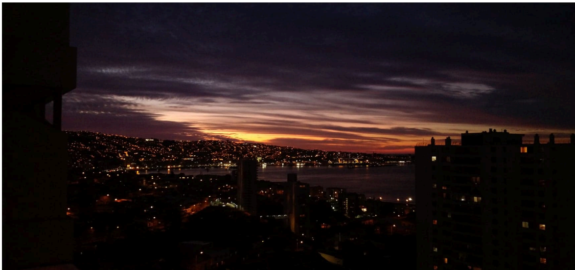
En gråare dag från balkongen

Tips. En väldigt bra chilensk hemsida för lägenheter är https://www.compartodepto.cl här kan man lägga upp en annons på vad man söker