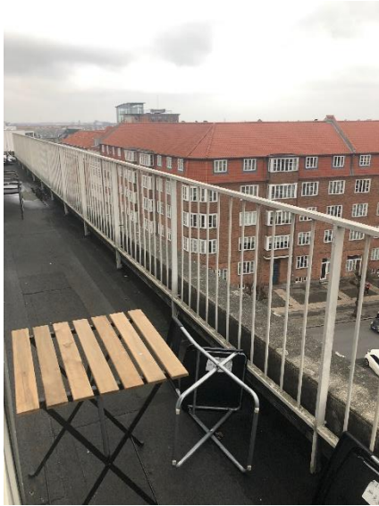
Vy från balkongen

ungefär en mil från skolan, men vi anammade dansk kultur och började cykelpendla dit. Köpenhamn är en cykelstad och det tycker jag verkligen att man ska utnyttja.