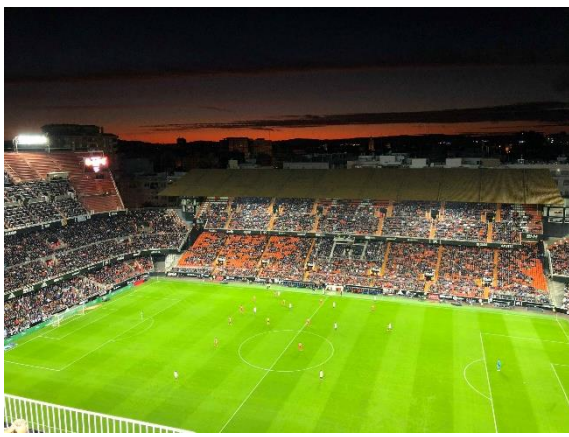
Mestalla – Valentias fotbollsstadium