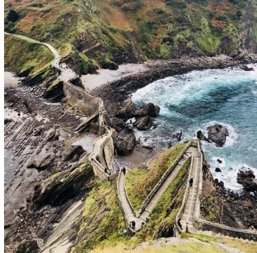
Gatzelugatxe i norra Spanien – kanske någon som känner igen från Game of Thrones?