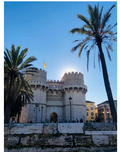
Torres de Serranos

Värt att tänka på: Dom flesta supermarkets är stängda på söndagar, ha alltid kontanter, säg alltid hej (Hola, Buenas) och hej då (Hasta luego).