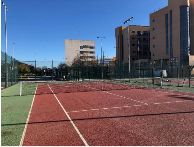
Tennisbanorna på skolan

Jag läste på "UPV Universitat Politècnica de València" som är stort i jämförelse med KTH. Nästan alla läser till ingenjörer eller arkitekter som på KTH och sedan finns det en liten fakultet Business Administration and Management som jag läste på. På skolan finns det ett stort utbud av olika sporter, och det känns som en ministad, då det finns allt ifrån apotek, bank, caféer, frisör & spa, sportbutik, blombutik och en doktor på campus. Tycker man om att träna kan jag rekommendera universitetets sportkort (40 EUR för en termin) som ger tillgång till ett gym, gruppträningar, fotbollsplan, boka tennis, paddel, volleyboll och klättring gratis samt en friidrottsplan där man kan springa.