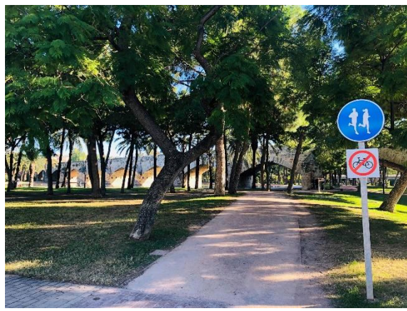
Löparspår i Turia parken

Under min utbytestermin var jag även iväg på två resor med organisationen ”Happy Erasmus”. Jag åkte till Marocko och Ibiza, mycket billigare än om man hade rest själv från Sverige då de får mängdrabatt på resorna. De har både längre resor men även dagsutflykter och är ett perfekt sätt att lära känna nya människor på! Alla är vänliga och nyfikna på att lära känna människor från andra länder och man lär känna vänner från världens alla hörn!