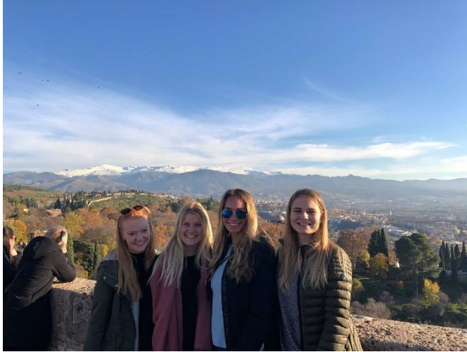
Besök på Alhambra med Sierra Nevada i bakgrunden