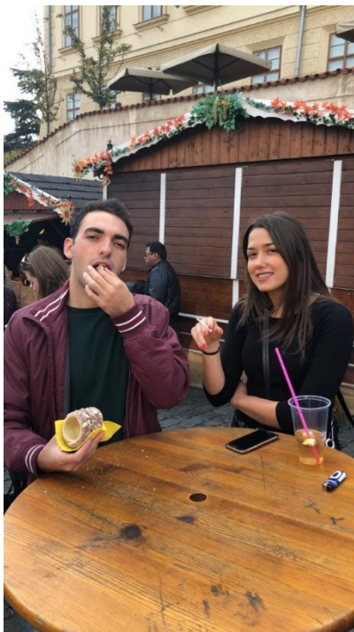
Rumskompisarna tog en öl och Trdelník.

Upplevde inte en kulturkrock i stan utan snarare i bostaden med italienarna. Ett tips om du vill dela lägenhet med andra nationaliteter är att försöka ha flera nationaliteter i hemmet. Dels för att lära sig om kulturer men även för att undvika att de du bor med exempelvis bara pratar italienska och bli exkluderad i diskussionerna på så vis. Annars rekommenderas att testa på att bo med varierande nationaliteter, det ger nya perspektiv och är lärorikt