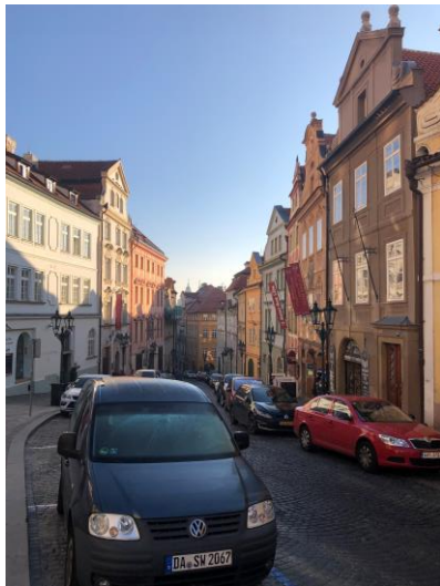
Malá Strana, Prag 1.

Det mesta är billigare i Prag om inte allt. Som att gå ut en kväll eller att gå på restaurang. De flesta valde att alternera restaurangbesök och hemlagad mat - priser för maten låg omkring femtio procent av priserna hemma i Sverige om inte mindre. Detta beror framförallt på vart i Prag du befinner dig i, där turismen finns är priserna högre.