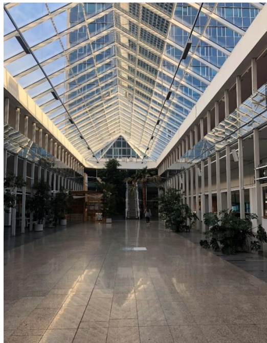
I fakulteten för civil engineering.

I CTU läste man fler kurser med färre poäng och kurserna varierar ofta mellan 2-7 ETCS samma motsvarighet som för hp. Under mitt utbyte läste jag 7 kurser - dessa går att se på kurslänken https://mobility.cvut.cz/prospectus/2018/FCE.html . De första två veckorna fick man se om de kurser man sökt innan man anlänt i Prag hade krockar. Denna period fanns möjligheten att även justera och fixa till kurserna för att få schemat och behörigheten att klaffa. Att läsa många kurser resulterar ofta i att man får läsa mer men är inte nödvändigtvis svårare. I de flesta kurserna är det inte krav på närvaro, men i vissa kurser t.ex. ekonomikurserna fanns närvarokrav på ca. 80 %.