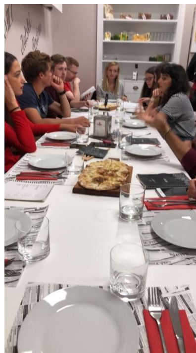
Middag på restaurangen da Tarquinio.