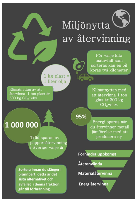
Bild 4: information till pentrynen, både hur man källsorterar och varför.