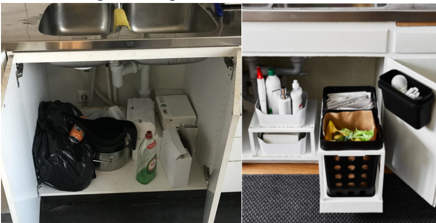
Bild 3: Lösning för skåp under vask, med 1 eller 2 matavfallsbehållare.