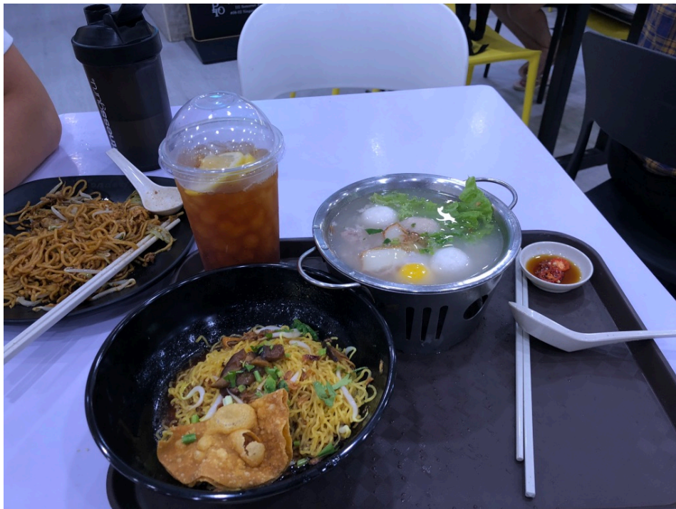
Lunch på campus

Det fanns många lunchställen att välja på runt om campus. Det var dessutom billigt. Utöver det fanns det s.k. hawker centers, d.v.s. foodcourts, ofta belägna utomhus, som serverar enkel billig mat. Maten höll genomgående relativt hög standard. Däremot började jag sakna svensk mat halvvägs in i terminen.