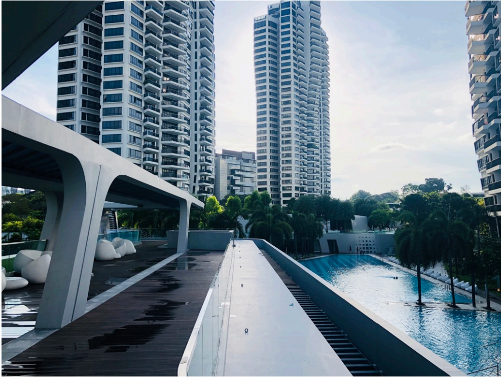
Vi bodde i huset t.v. i bild

Det fanns många lunchställen att välja på runt om campus. Det var dessutom billigt. Utöver det fanns det s.k. hawker centers, d.v.s. foodcourts, ofta belägna utomhus, som serverar enkel billig mat. Maten höll genomgående relativt hög standard. Däremot började jag sakna svensk mat halvvägs in i terminen.