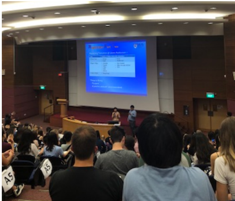
Första föreläsningen på NUS