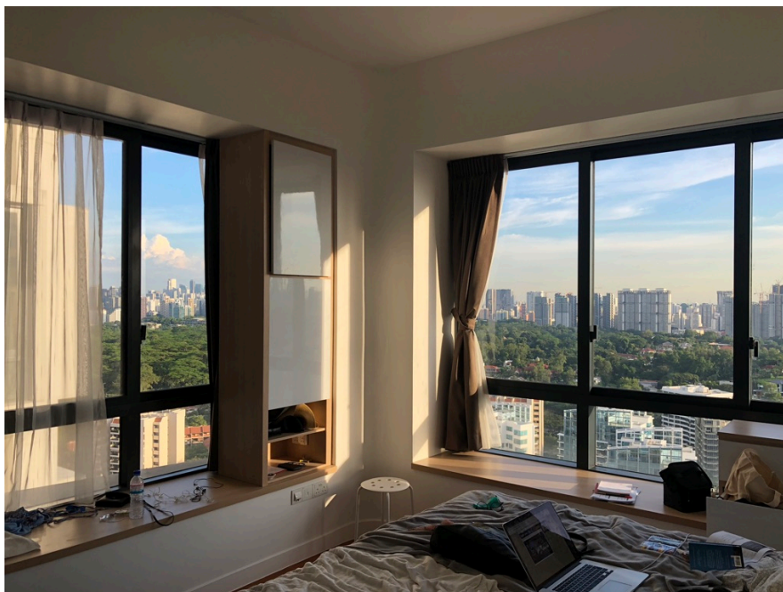
Ett av sovrummen i lägenheten där vi bodde

Singapore är en dyr stad. Vi hyrde en lägenhet i utkanten av stan i ett område som hette leedon heights. Det var en trevligt område med nybyggda hus. Vi bodde fem personer från Stockholm i lägenheten och vi betalade ca 1 000 SGD var i månaden vilket motsvarar ca 6 800 kr.