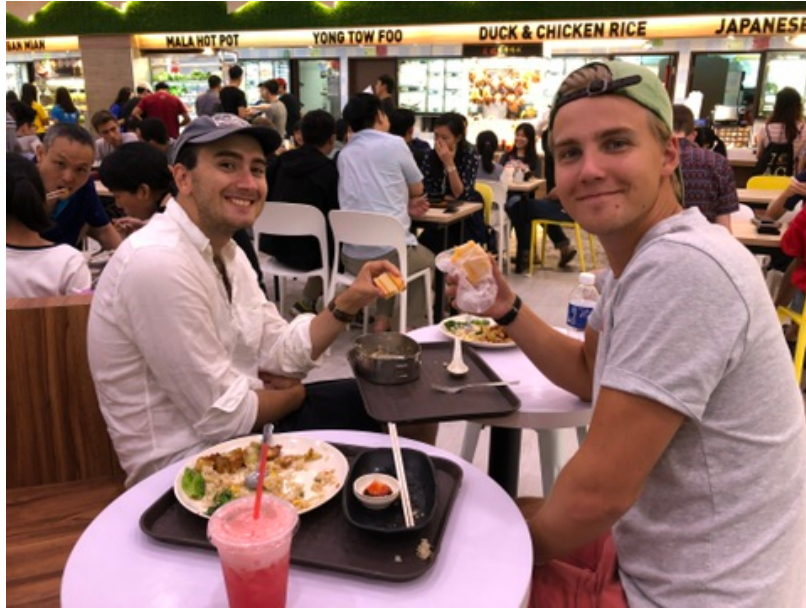
Jag och min klasskompis från KTH äter lunch på campus första dagen

Jag landade på Changi airport i Singapore dagen innan den första introduktionsföreläsningen. Veckan som följde var det inga föreläsningar och vi utforskade staden. Därefter började den en s.k. add/drop-period. Detta är en period när man väljer de kurser man vill läsa. Det är svårt att få de kurser man vill ha och samtidigt måste man kommunicera med KTH om de går att tillgodoräkna. Det var hög konkurrens på data-kurserna och efter mycket om och men så löste det sig till slut.