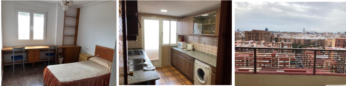
Mitt rum, samt vårt kök och vår balkong.

person och månad, och då ingick el, vatten, gas och internet. Vi betalade också en avgift till agenturen som ordnade uthyrningen (det gjorde de flesta jag kände också). Inklusivt den avgiften landade månadskostnaden per person på ~300 €.