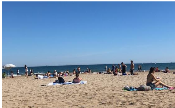
Malvarrosa beach, ca 3 km lång och jättefin strand!