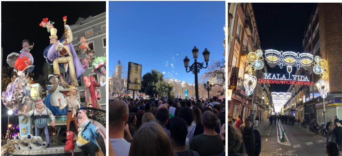
Bilder från Fallas: En av massvis med skulpturer, en så kallad "Mascleta" och hur gatorna såg ut.