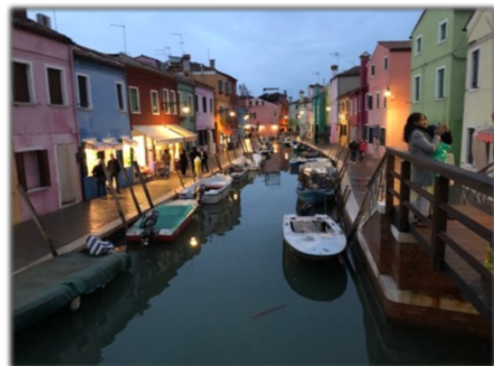
Burano, en ö utanför Venedig

Jag började att spela i ett futsal-lag. Laget bestod till störst delen av tjejer från Italien men även några Erasmus-tjejer var med. Vi körde en träning och en match i veckan. Det var roligt att spela med det här laget men vi hade lite kommunikationsproblem då många, där ibland tränaren, inte var så bra på engelska.