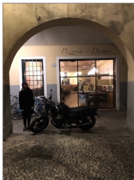
Bästa pizzerian, tvärs över gatan från oss, och Bästa roomie.

Jag ansökte om att få boende via skolan men då de hade begränsat antal platser blev jag dessvärre utan. Istället fick jag tillsammans med en annan CMEDT-student tag på ett boende via Airbnb. Det låg mitt i centrum, cirka trettio minuters gångväg från campus. Lägenheten bestod av åtta stycken rum – varav vi delade på ett – med gemensamt kök men med egen toa och dusch. Kostnaden var ungefär 3000 kr/person i månaden. Enda nackdelen var att det inte fanns någon tvättmaskin utan vi fick leta oss till ett tvätteri, vilket låg nära men var väldigt dyrt.