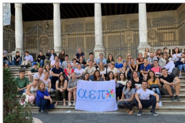
Stadsvandring i Padova

Den officiella skolstarten var den första oktober men veckan innan anordnade ESN-gruppen (Erasmus student network) en mottagningsvecka fylld med aktiviteter som stadsvandring, pizzakväll och quizz-night.