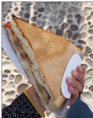
Lunch för 2 euro

Det erbjöds även en gratis språkkurs för Erasmus-studenter, där jag fick chansen att läsa Italienska på A1 nivå (nybörjare). Jag tycker inte att den här kursen var så givande, den var rörig och kursen tog mycket tid (2x2h i veckan + hemuppgifter).