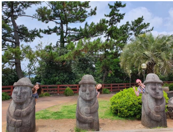
Bilder från fantastiska Jeju.