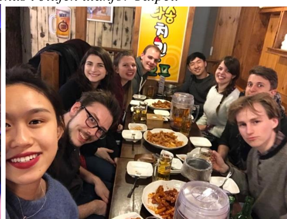
Och vänner för livet.