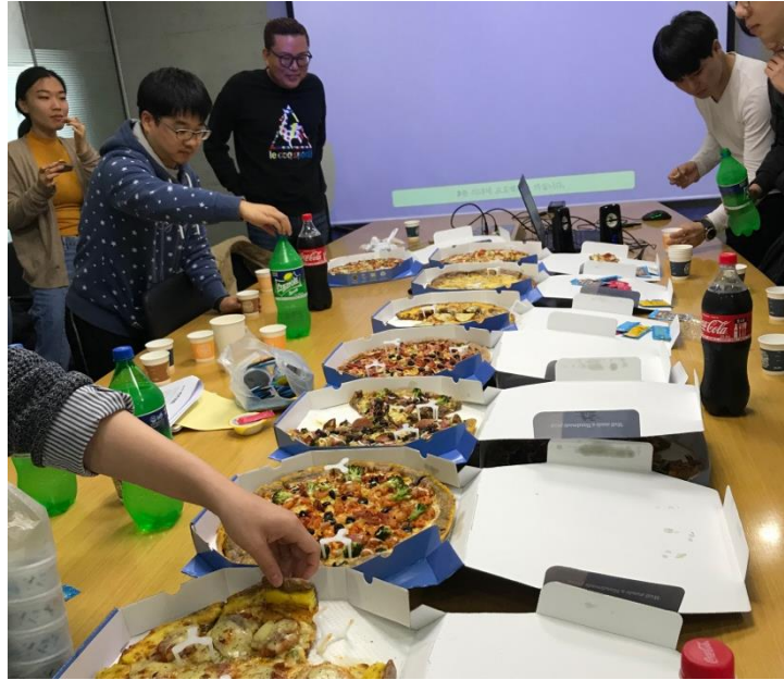
Vid några tillfällen hade vi dubbellektion i Brain IT, då bjöds det på lunch.

HSS586 Korean 1 for international graduate students – En grundläggande kurs i koreanska. De första veckorna går man igenom alfabetet, därefter lärde vi oss att introducera oss själva, beställa mat, räkna, och lite grammatik. Professorn var väldigt rolig och uppskattade om man var aktiv under lektionerna. I kursen hade vi en midterm och en final exam.