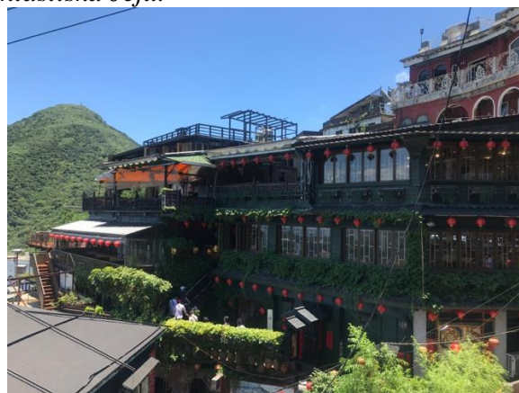
Shanghais skyline och ett tehus i Jiufen utanför Taipei.