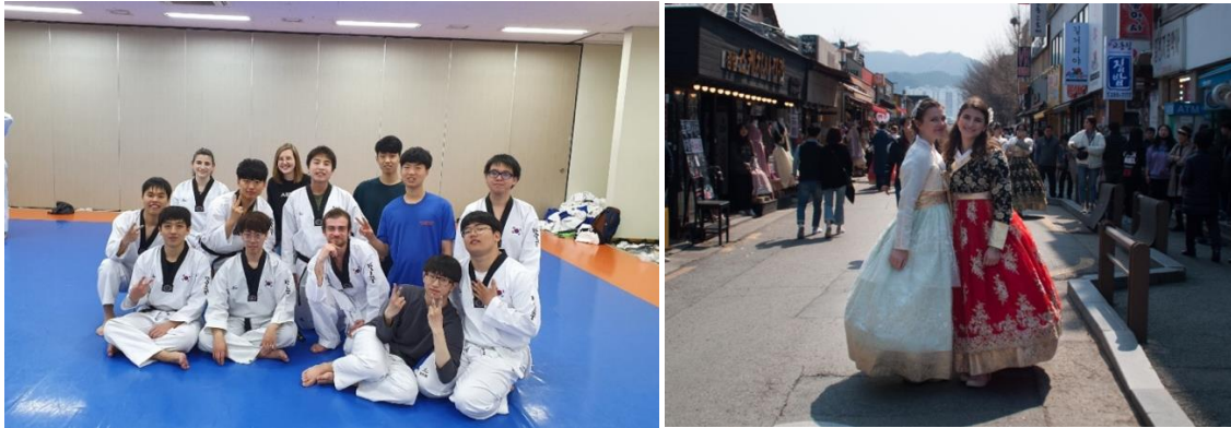
Min taekwondoklubb till vänster, till höger en bild från vår dagstur till Jeonju.

Det finns även klubbar och grupper som arrangerar event för internationella studenter. International Student Organization (ISO) arrangerade resor och utekvällar. ISSS arrangerade en dagstur där vi fick chansen att klä oss i traditionella kläder. Och om du går med i Buddy Programmet så kommer du och din grupp att hitta på saker tillsammans. Under terminen sker flera olika event och aktiviteter på campus. Bland annat hölls KAIST Spring Festival under våren där flera kända koreanska artister och grupper uppträdde under kvällarna.