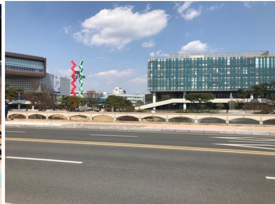
Till vänster är mitt department och till höger en bild på campus.