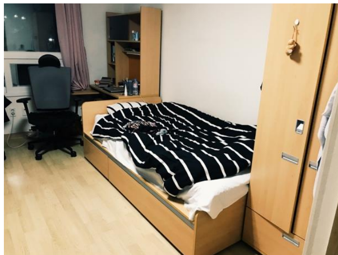
Min del av rummet. Sängkläderna tog jag med mig hemifrån.

I själva byggnaden fanns en närbutik som var öppen mellan kl 18-02. Perfekt för att köpa snacks och andra små nödvändigheter till boendet. På andra våningen fanns ett gym som delades mellan tjejerna och killarna. På varannan våning fanns det en vattentank med varmt och kallt vatten, samt en mikrovågsugn. Det var det närmsta som jag kom matlagning under hela terminen. Eftersom att det inte finns någon kyl eller ett kök i boendet så gick det inte att laga mat. Vanligast är att man äter ute så jag tyckte aldrig det var något större problem förutom med frukosten. Frukost löste jag genom att köpa havregryn och göra gröt i mikron. Jag köpte även mjölk med lång hållbarhet som jag förvarade i garderoben och använde för flingor och kaffe. Det finns några supermarkets där man kan hitta mat och bra saker till rummet, bland andra Homeplus och E-mart.