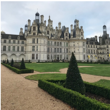
Château de Chambord