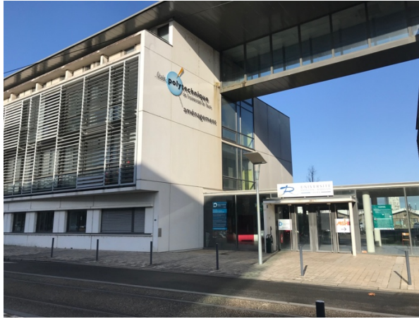
Campus för École Polytechnique de l'Université de Tours (aménagement)

En vanlig skoldag varade mellan kl 8 – kl 18, där cirka 2 – 4 timmar utgjordes av föreläsningar och resten av tiden var eget arbete med olika projekt, vilket stöttades av lärare på plats. Den största skillnaden jämför med KTH var att det i princip alltid var obligatoriskt att vara på plats, även om det vissa dagar endast var eget arbete på schemat. Man fick även betydligt mer stöd i arbetet av kursansvariga, professorer och assistenter.