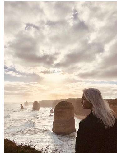
"Campus", mitt i centrum & Great Ocean Road