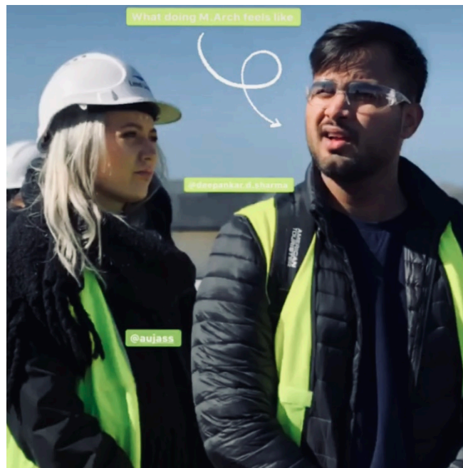
Jag och en klasskompis på platsbesök, fotot även omnämnt till ” What doing Masters of Architecture feels like ”