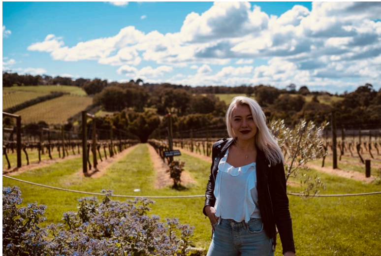
Mycket fina vingårdar någon timme ifrån Melbourne!

Vi var bara några från klassen som umgicks på den lilla, lilla fritiden som vi ibland hittade tid för. En av dessa bodde på ett sådant studentboende, där vi ofta träffade elever från andra fakulteter som hade saker de ofta hittade på tillsammans. Det blev nog en stor del av min upplevelse, att 'de-stressa' med de, gå på någon bar, ta sig ut till Fitzroy eller Chapel street och se mer av staden. Det fanns otroligt många föreningar man kunde gå med i på universitetet och det verkade som att det var många som hittade sina vänner där, men eftersom de ofta krockade med arkitekturstudenternas scheman blev det inget just för mig.