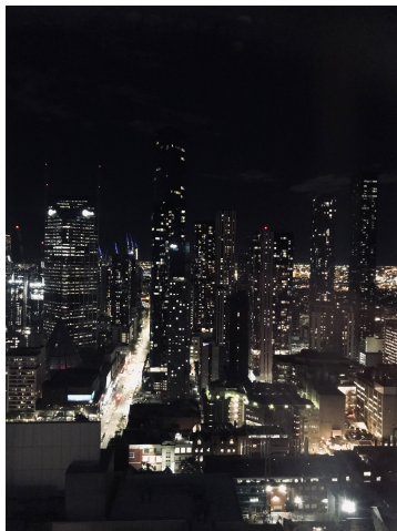
Utsikt från student-boendet