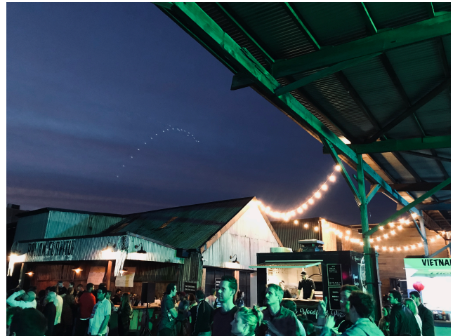
festival i avslutnings-present