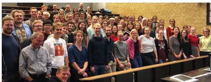
Figur 4: DTU choir under en repetition. DTU Lyngby.

Jag gick med i ”DTU choir”, som introducerades under mottagningsveckan. Alla är välkomna till kören, oavsett om du är student eller anställd, det fanns även diplomerade studenter som jobbar, men fortsätter att komma varje vecka för att sjunga med varandra. Vi sjöng olika låtar, mestadels pop-klassiker, nya och gamla låtar. Kören bestod av ca 100–150 personer. En fantastisk möjlighet att utforska sig själv och prova på något nytt. Självt har jag aldrig sjungit för någon eller med någon, därför var det ovanligt för mig i början. Vi har uppträd för DTU samt några organisationer och allmänheten. Superkul och trevligt var det.