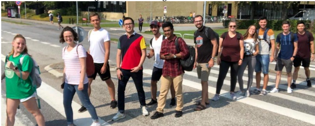
Figur 2: Min ”Buddy-group” under introduktionsveckan, jag är den tredje personen från vänster.

”Rejsekort” – motsvarigheten till SL-kortet och sist men inte minst hyrt en cykel. Man kunde hyra cykel månadsvis, vilket var smidigt och enkelt för mig.