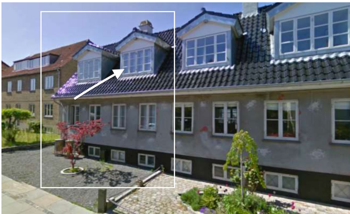
Figur 3: En skärmbild på mitt boende. Odinsvej 12B, 2800 Kongens Lyngby.